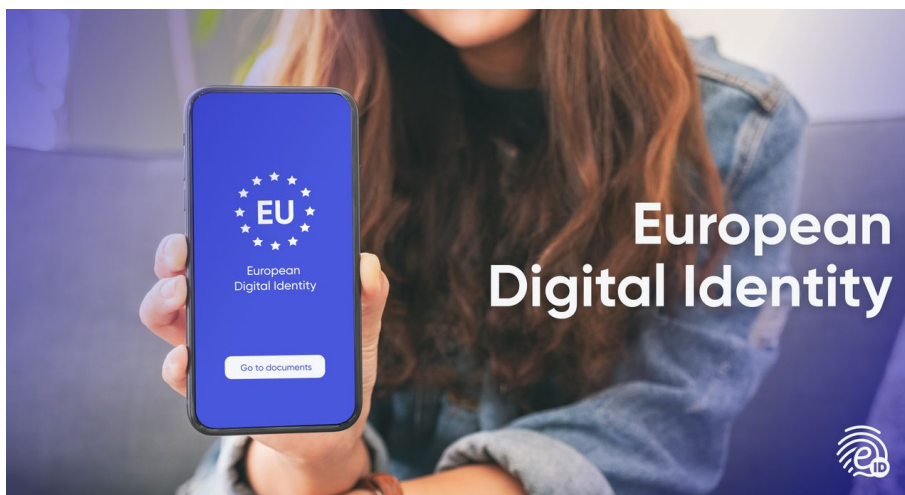
Jedním s pilířů transformace do Evropské federace je projekt Evropské digitální identity

NATO přitom nemohlo jít s nadšením do války na Ukrajině, protože by to rozpoutalo III. sv. válku s Ruskem. Nicméně v Bruselu se teď říká, že zmýlená neplatí. Prostě porážka Ukrajiny bude a vlastně už teď je předhazována NATO a potažmo USA jako jejich chyba. A tato obvinění začnou zesilovat a padat hlavně na hlavu USA, kdy se nakonec země EU a NATO shodnou, že vinu za porážku Ukrajiny nesou... USA! Obětní beránek se steroidech.