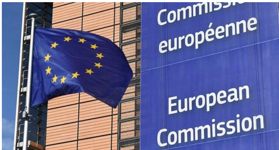
Evropská komise má být transformována do evropské vlády

Supertalíř je výraz německých ekonomů pro objem vybraných daní určených k přerozdělení. Evropský supertalíř bude kompletně řešit mandatorní výdaje a fiskální rozpočty takovým způsobem, aby ze supertalíře proudily peníze po celé Evropě do programů, které v té době už národní vlády nedokáží objektivně či úmyslně financovat, jako právě důchody. Všechno je to součást plánu.