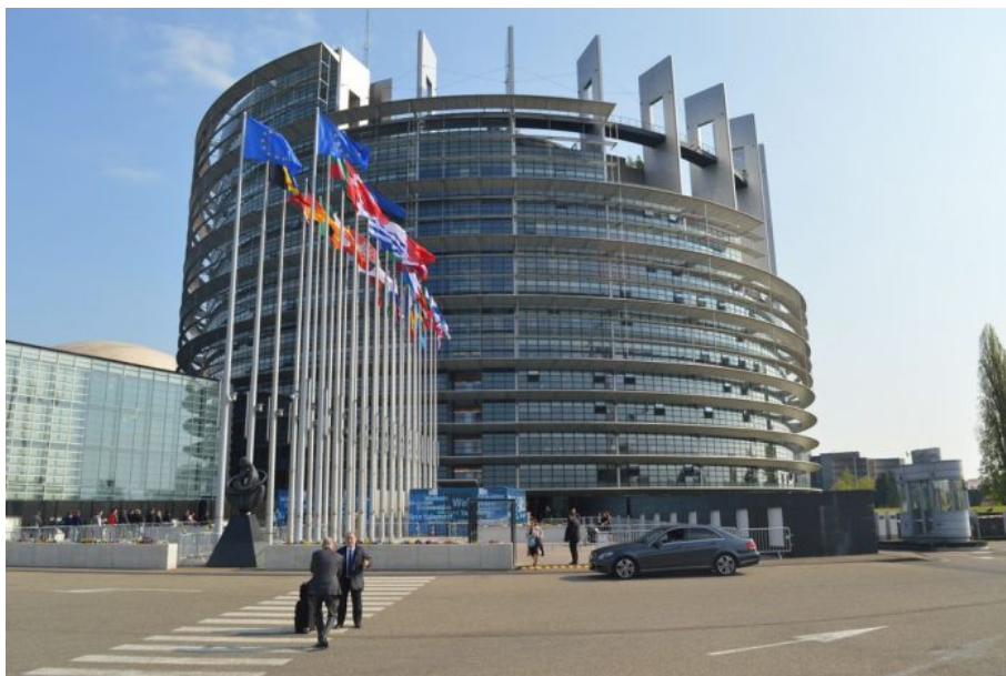
Budova EU parlamentu ve Štrasburku připomíná nedokončenou Babylonskou věž, vrcholný symbol globalistů pro nedokončený proces

Tohle nevzniklo ze dne na den. To bylo celou dobu v nich, pouze to maskovali pod rouškou evropského liberalismu, ale teď už to není potřeba. Ověřili si během covidové operace, že lidi lze ovládat jako ovce a dokonce do nich píchat nevyzkoušené roztoky, jako to dělal v Birkenau židovským vězňům Dr. Mengele. Viděli v letech 2020 a 2021 na vlastní oči, že jim to nejen projde, ale lidi se jim samí staví do fronty na mutagenní roztoky jako při projevech Stockholmského syndromu. To je povzbudilo.