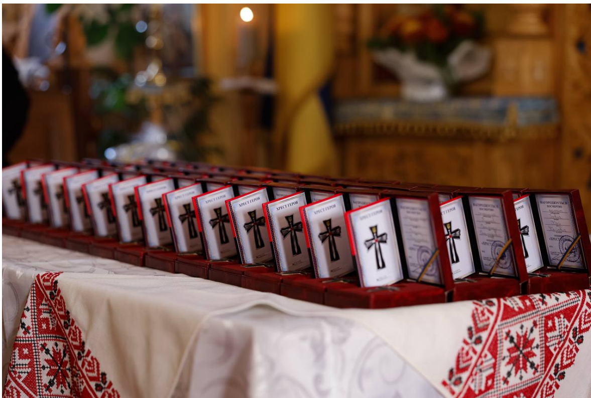
Důkaz – 39 vyznamenání padlým!

Včera večer šéf vojenské správy Zakarpatí Viktor Mikita v souvislosti s úderem na shromáždění 128. brigády vyhlásil : Žádám všechny obyvatele, obce, a podnikatele v zařízeních veřejného stravování, aby se v nejbližších dnech vyvarovali jakýchkoliv zábavních akcí, koncertů apod. Radím Vám, abyste navštívili chrámy a modlili se za naše obránce! A svá vyhlášení doprovodil fotografiemi z chrámu , kde se konala zádušní mše za padlé hrdiny ze 128. brigády. Podle fotografií se společná mše v chrámu na Zakarpatí konala za 39 hrdinů , kteří byli Zelenským vyznamenáni, a k jejichž uctění bylo také svoláno to shromáždění velení Ukrajinské armády, které v Záporoží rozmetal jediný Iskander . 128. brigáda musela v posledních dnech utrpět strašné ztráty, protože ani smrt 39 hrdinů, kteří byli vyznamenáni, a smrt desítek či stovek dalších, kteří padli v předchozích pozemních bojích bez vyznamenání, nevyvolala tak bouřlivou ukrajinskou reakci jako tento jediný úder Iskanderu! Rusové odhadují nevratné ztráty tímto úderem na 20 až 140 Chocholů!