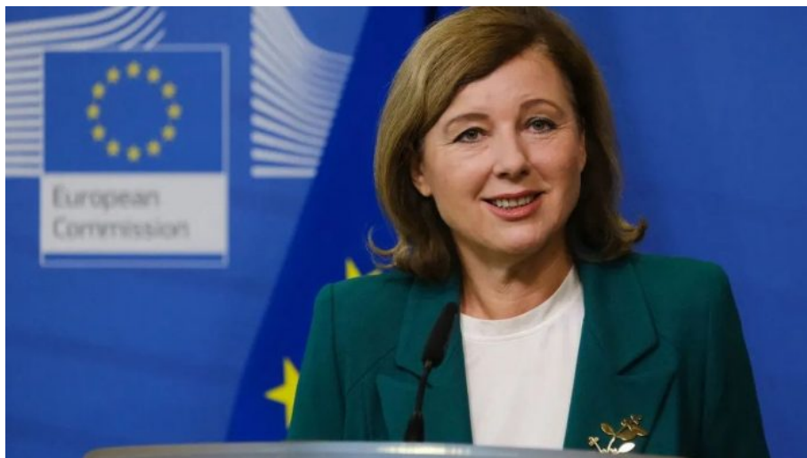
Věra Jourová, komisařka EU pro hodnoty a transparentnost

Zablokování webů se přitom ukázalo jako naprosto jalové, ale snahy o cenzuru nepohodlných webů odkopaly úmysly a cíle Fialovy vlády na ukotvení bezbřehé totality, která produkuje politické vězně v kriminálech a politické vězně na útěku. Opoziční názory se staly předmětem profesních likvidací, zbavování profesorů jejich pozic na zfašizovaných českých vysokých školách, tahání učitelek po soudech, že řekly pravdu o tom, že v Kyjevě je normální život a nic tam nepřipomíná válku, že tam dokonce Ukrajinci jezdí na dovolenou z ČR. Jakákoliv nežádoucí informace má být umlčena!