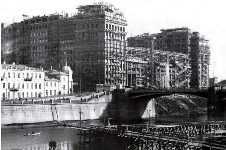
Jedna z prvních Stalinovek – Iofanův komunální soběstačný komplex v Moskvě v době výstavby

low emission zones), kde se platí za provoz aut strašné poplatky, a to každý den. Cílem globalistů je upoutat lidi na jedno místo jako do kriminálu, jako do koncentráku, protože zbytnost lidské práce a následně zbytnost lidské existence se kvapem blíží.