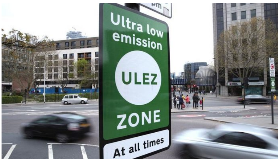
Nízkoemisní zóna v Londýně, kde se platí vysoké poplatky za každý průjezd

Pokud lidé budou uzavřeni na jednom místě, v lockdownu, anebo v 15-minutovém městě, když budou pokutováni za jízdu někam autem v systému ULEZ, tak prostě dojde k indukci modelu nerozvinuté společnosti, která nikam nejezdí, je na místě, komunikuje na dálku elektronicky, ale s nikým se fyzicky nestýká. Spolu s tím bude indukován nepodmíněný příjem. A ten bude ale přece jenom podmíněný, a tím bude platný vakcinační pas a zřejmě i slušné sociální kreditní skóre.