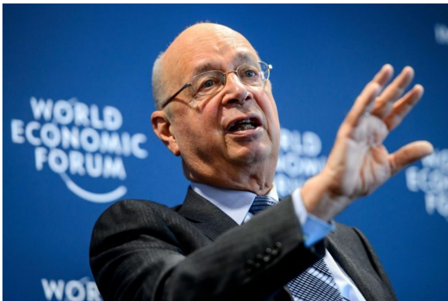
Klaus Schwab, šéf Světového ekonomického fóra

Omezení cestování proto nemá ze strany globalistů nic společného s ekologií a podobnými nesmysly, když každý ví, že jen všechny světové aktivní sopky vychrlí za rok do atmosféry v průměru 150x více CO 2 , než všechny lidské průmyslové exhalace celého světa za rok . Omezení pohybu je zkrátka návratem do doby, kdy lidé necestovali a neopouštěli své vesnice, kde se narodili a maximálně došli pěšky několikrát za život do vzdáleného správního města.