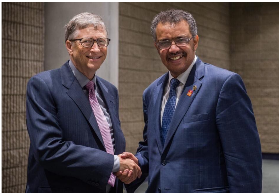
Bill Gates a Tedros Adhanom Ghebreyesus, šéf WHO

System 15-minutových měst má tudíž navodit fyzickou, ale nikoliv sociální izolaci. Lidé se budou moci vidět, ale jen dálkově na telefonu, na displeji, ale nebudou se moci setkat. Dojde tím přesně k naplnění děsivé vize Stanislawa Lema, takže to povede k umělému a řízenému oplodňování, což bude mít pod kontrolou světová vláda. V zájmu eliminace CO2 a NOx a z důvodu překročení letošní kvóty žadatelů vám byla žádost o iniciaci (početí in vitro) dítěte zamítnuto. Další žádost o přezkum si můžete podat za rok od doručení tohoto oznámení. Takové oznámení dostanete jako rozhodnutí správního regulačního orgánu do emailu.