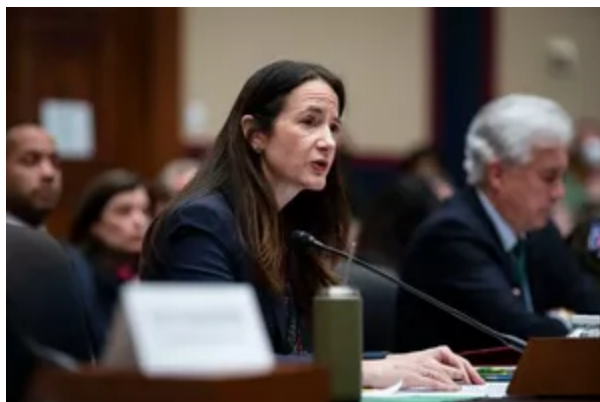
Ředitelka Národní zpravodajské služby Avril Hainesová

Patří sem i zavraždění „nejméně půl tuctu ruských agentů, vysoce postavených separatistických velitelů nebo spolupracovníků“ před zvláštní operací, z nichž jeden byl zabit v Moskvě, a desítky dalších po únoru 2022. První část tohoto odhalení potvrzuje , že USA vedly svou zástupnou válku proti Rusku prostřednictvím Ukrajiny dlouho předtím, než bylo Rusko nuceno zahájit svou speciální operaci jako poslední možnost, jak udržet integritu svých červených linií národní bezpečnosti, které Washington postupně narušoval.