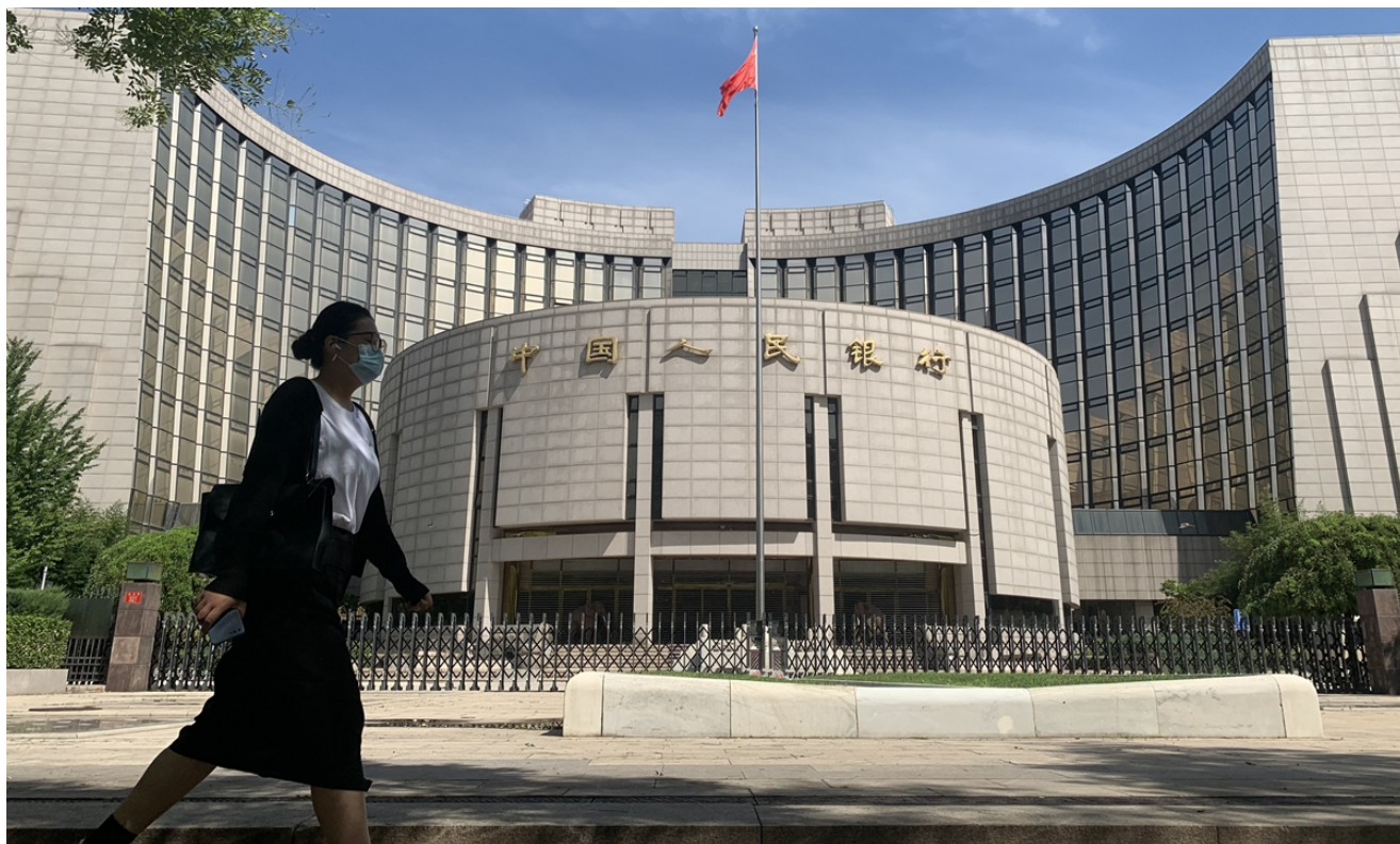
Pohled na budovu PBC v Pekingu

Čínský finanční systém zavede makroregulaci "přesným a důrazným" způsobem v reakci na ekonomickou situaci, řekl guvernér čínské centrální banky v rámci širšího úsilí země o posílení důvěry trhu a posílení oživení druhé světové ekonomiky. největší ekonomika.