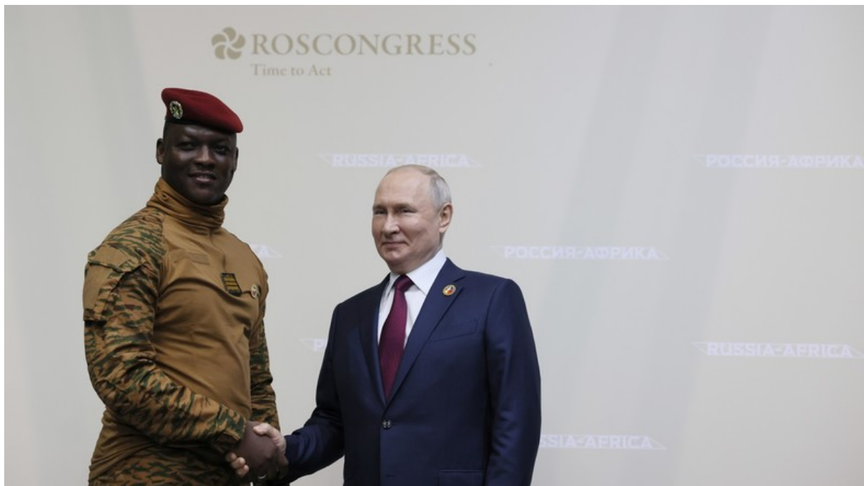
Kapitán Traoré a Vladimir Poutine, v červenci v Petrohradu u příležitosti summitu Rusko-Afrika (ilustrační obrázek)