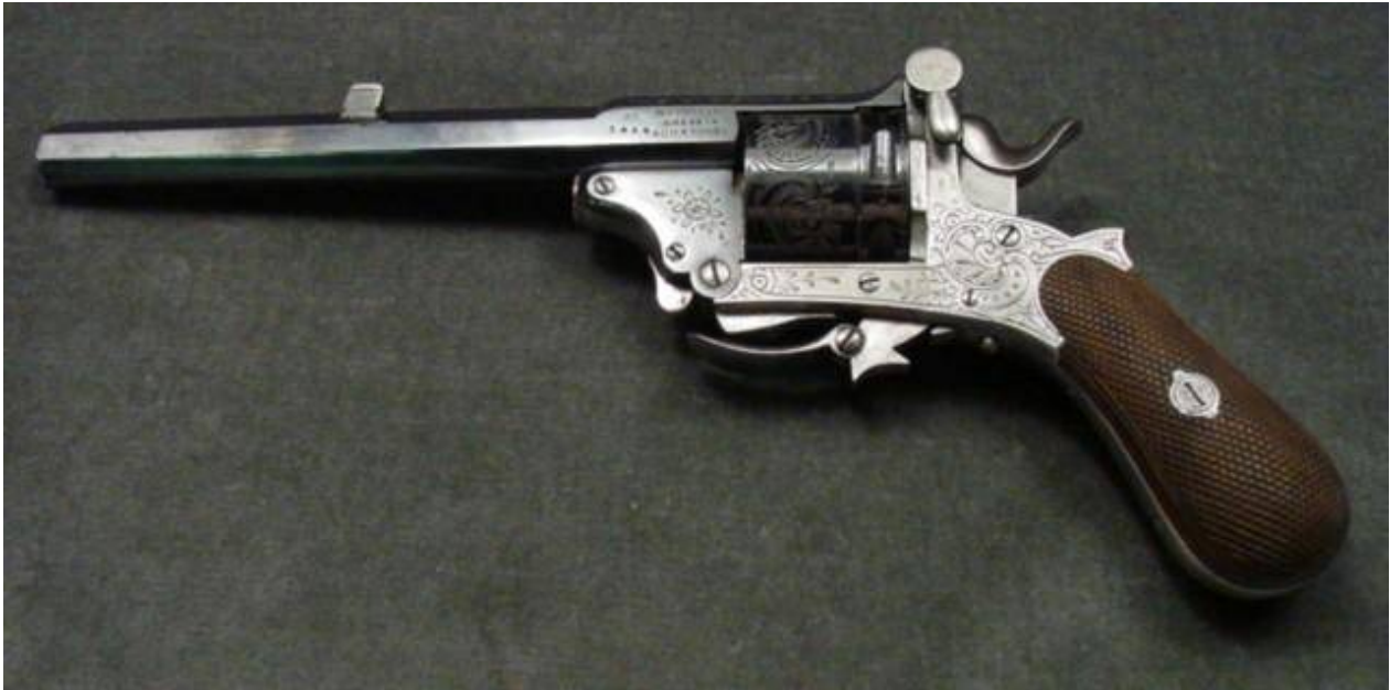
Revolver Dessarda Josepha Nicolase...