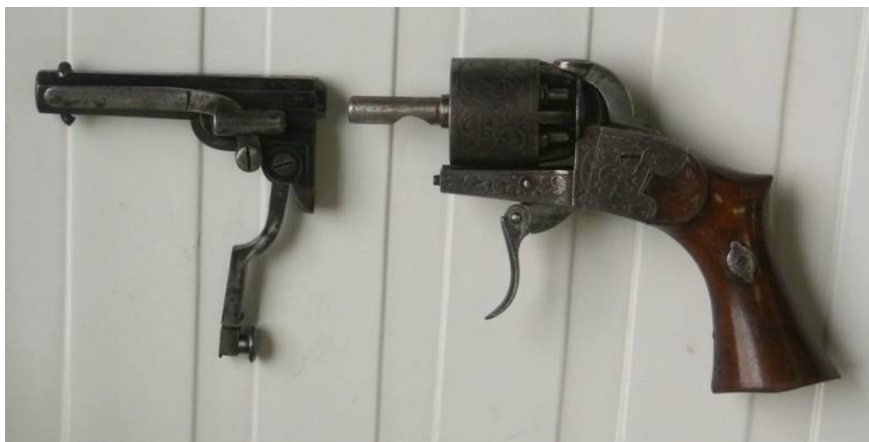
Depret revolver rozebrán