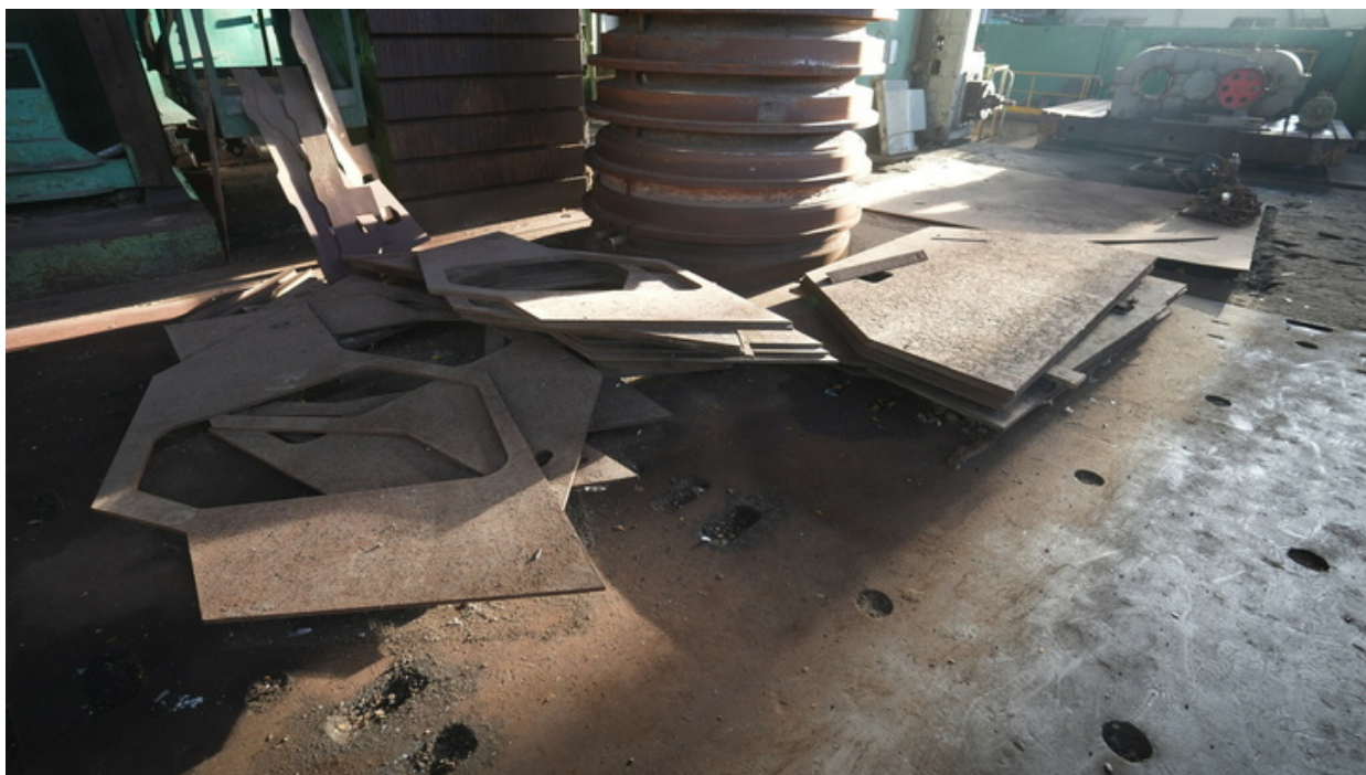
Díly pro obrněný transportér.

Na pracovním stole těžkého stroje jsou boky ukrajinských obrněných transportérů. Jak ležely 23. února 2022, leží na stejném místě i nyní.