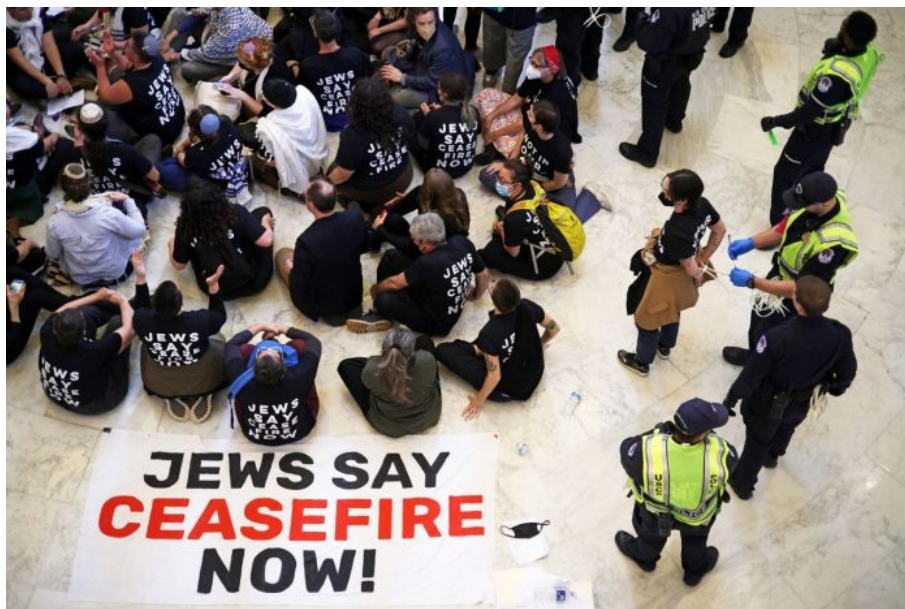
Protestující požadovali okamžité příměří v Gaze

Takže pouze ortodoxní Židé se zastanou Palestinců a jejich práva na sebeurčení a vlastní stát Palestinu. Nikdo jiný se jich nezastane, protože sionisté a a chazarští ovládají všechny procesy v prostoru kolektivního Západu. Podpoří je sice arabský svět, ale ten nemá zatím tu světovou moc, aby to mohlo něco změnit.