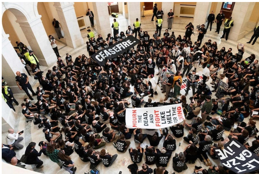
Protest Židů ve vstupní hale Kongresu

Po skončení protestu byli sice všichni zatčeni, ale čistě formálně, přičemž budova Kongresu je přístupná veřejnosti, takže nešlo o násilné vniknutí, ale půjde zřejmě o nedovolené shromáždění. Nicméně se ukázala jedna zásadní věc. Palestinci mají naprosto a zdánlivě nepochopitelně jediné a silné zastání v dnešní době jen a pouze u ortodoxních Židů v USA! Nikdo jiný se jich nezastane a už vůbec ne tak odvážně, že by uspořádali protest na podporu Palestiny přímo v Kongresu.