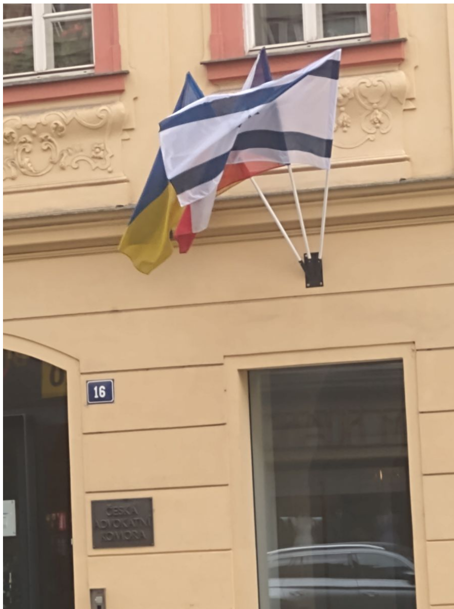
Budova České advokátní komory v Praze. Holt, hodnotová Praha s hodnotovým premiérem potřebuje i hodnotové advokáty

Pokud se v tom už ztrácíte, tak nejste sami. Tohle je totiž absurdní divadlo, při kterém jenom je likvidován jeden celý národ, který má tu smůlu, že nemá na svém území ropu, suroviny a ani nesousedí s Ruskem nebo s Čínou, aby mu přišla na pomoc západní věrchuška se slovy, že na Palestině závisí svoboda světa a je nutné ji vyzbrojovat.