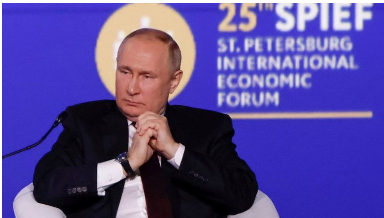
Vladimir Putin, prezident Ruské federace

Ekonomický rozvoj Jižní Koreje po skončení války totiž nastal kvůli garanci a rozmístění americké armády v Jižní Koreji, která fungovala a dodnes funguje jako psychologická pojistka pro západní investory , že KLR nevtáhne do Jižní Koreje a nedojde ke znárodnění západních investic a podniků v Jižní Koreji. Jenže na území Ukrajiny v případě příměří žádný takový kontingent americké armády nebude. A to právě kvůli strachu z oživení války s Ruskem po vstupu US Army, a tentokrát v přímém střetu Rusů s NATO. Proto se nedá očekávat, že se investoři pohnou na Ukrajinu a bez peněz a investic nemůže Ukrajina přežít. Proto krach Ukrajiny po vyhlášení a dojednání eventuálního příměří je velmi pravděpodobným scénářem.