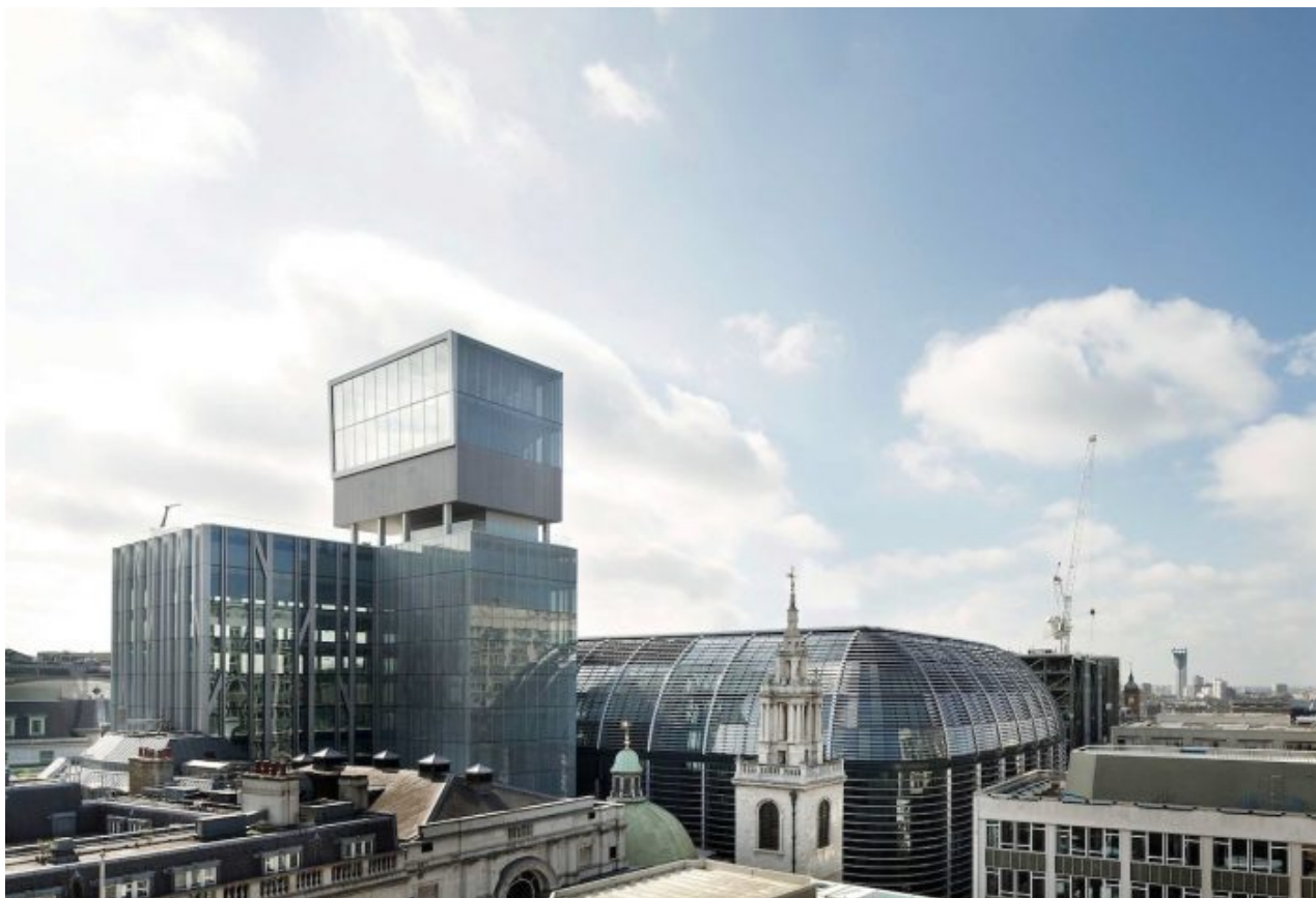
Hlavní nervové centrum války na Ukrajině – Londýnské kanceláře Domu Rothschild

Takže, když nevyjde plán na poražení Ruska, vyjde plán na rozkradení, rozparcelování a rozporcování celé Ukrajiny, která se tomu už v té době nebude moci bránit, protože všichni její muži budou pryč. A to pryč znamená, že buď budou po smrti, nebo budou jako uprchlíci v EU, v Rusku a v podstatě po celém světě. Na Ukrajině zůstanou jen důchodci, kteří jednoho dne umřou a celý ukrajinský národ na území Ukrajiny vymře.