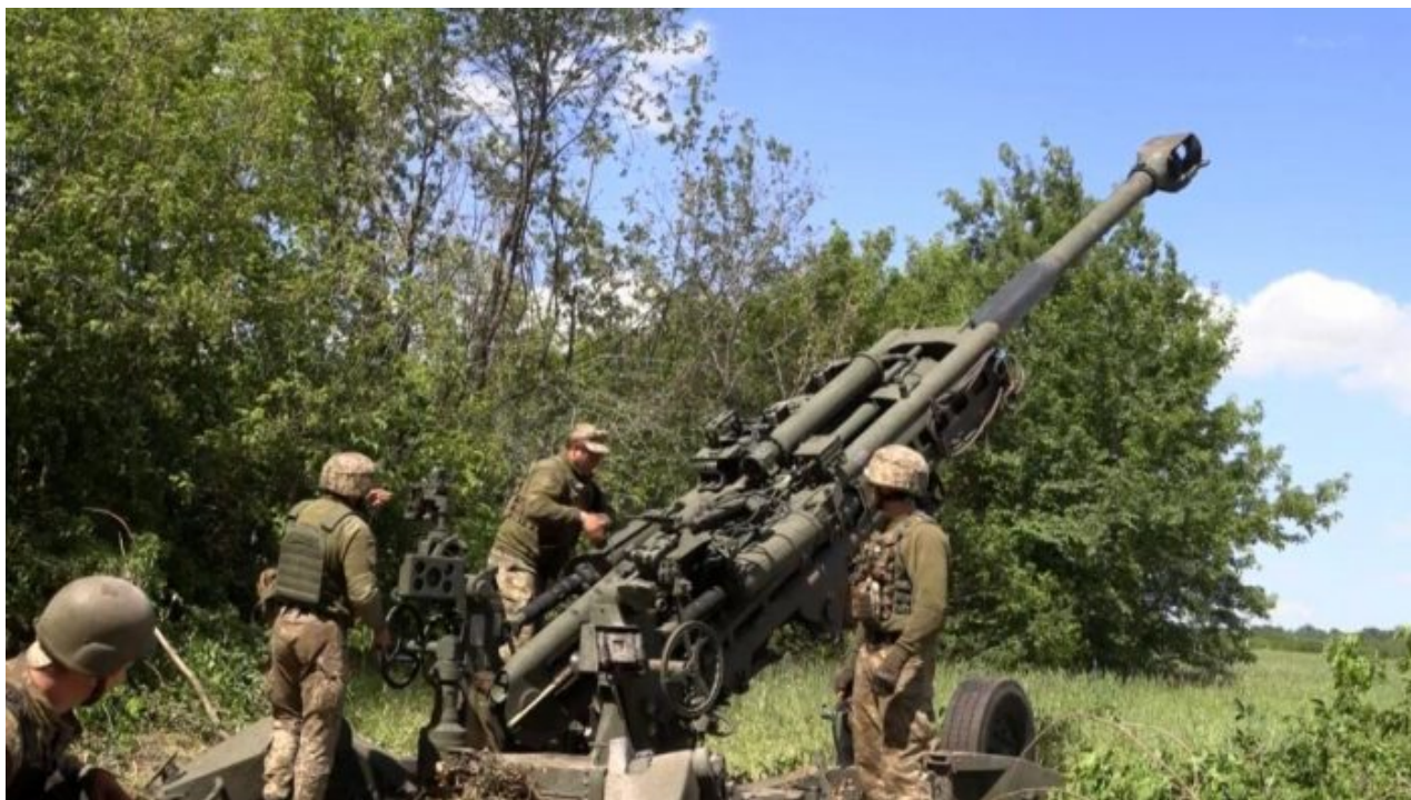
Ukrajinská četa u houfnice M-777

Nedotknutelní Ukrajinci, kteří byli ochraňováni a upřednostňováni, se najednou stali terčem lovu a deportačních řízení, protože Ukrajina obvinila všechny ukrajinské muže ve věku od 18 do 60 let, kteří uprchli do Evropy a tím se vyhnuli mobilizační povinnosti.