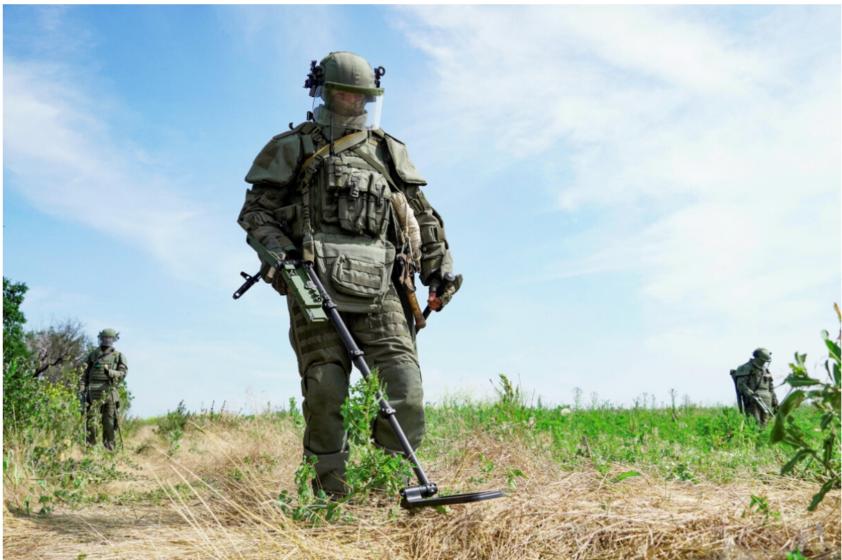
Ruští vojáci s vybavením pro likvidaci výbušnin (EOD) při odminování pole v Doněcku na Ukrajině 23. června 2023.

Koncem srpna byl Bílý dům nucen upřesnit, že nepovažuje protiofenzívu za patovou, ale že je otevřen “vyjednanému mírovému” řešení mezi Ukrajinou a Ruskem.