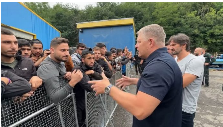
Robert Fico ve Velkém Krtíši při rozhovoru s migranty

A když jsi proti nám, tak to znamená, že jsi s nepřítelem, s Ruskem, s Čínou, s kýmkoliv jiným, kdo je také proti nám. A proto tě musíme zahájit a ukončit! A jak je vidět, Jourová si posvítla na Elona Muska a není daleko okamžik, že EU zakáže provoz Twitteru na území Evropské unie. Podle mého názoru počkají do voleb nového prezidenta v USA, a pokud to vyhraje Trump, tak Twitter v Evropě skončí. Na platformě Twitter/X je opravdu obsah, který dávno už jinde nenajdete na tzv. velkých soc-netech a Evropská unie nenechá Muska, aby jim rozvracel volnomyšlenkářstvím jejich Eurosojuz.