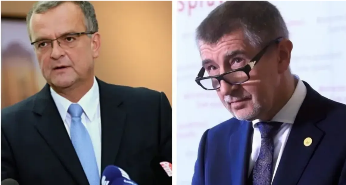
Miroslav Kalousek a Andrej Babiš