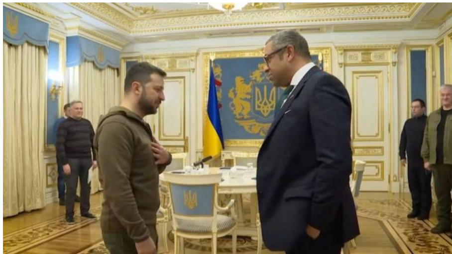
Komediant před pádem z Londýna. Volodymyr Zelenskyy a James Cleverly, britský ministr zahraničí

Jisté je ovšem jedno, že o tuto čtvrtou a závěrečnou hereckou pózu nepřijdeme a je velká naděje, že z těch 4 iterací to bude jediná, která nebude pózou, ale skutečným projevem, autentickým exaltem politické smrti komedianta, který přivedl svůj národ na pokraj zániku v ubohém žoldu londýnských hrdlořezů v bílých límečcích a křivých kravatách, ze kterých je cítit pach krve a potu, ale ne jejich vlastního.