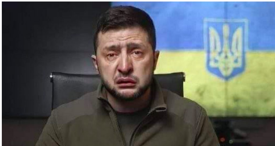
Zelenského alternace oběti, póza č. 2

Ještě předtím totiž přivede ukrajinský národ na pokraj vlastní genocidy a vyhlazení v beznadějně válce do posledního Ukrajince. A pokud Evropa přestane pomáhat a dodávat zbraně, tak jí vyhrožuje nepokoji a povstáními Ukrajinců. Jeho poslední video, ve kterém znovu vyhrožoval Evropě nepokoji ukrajinských uprchlíků, pokud by došlo k zastavení vojenské a finanční pomoci Kyjevu, pouze odhaluje pravý naturel Zelenského – je to vyděrač!