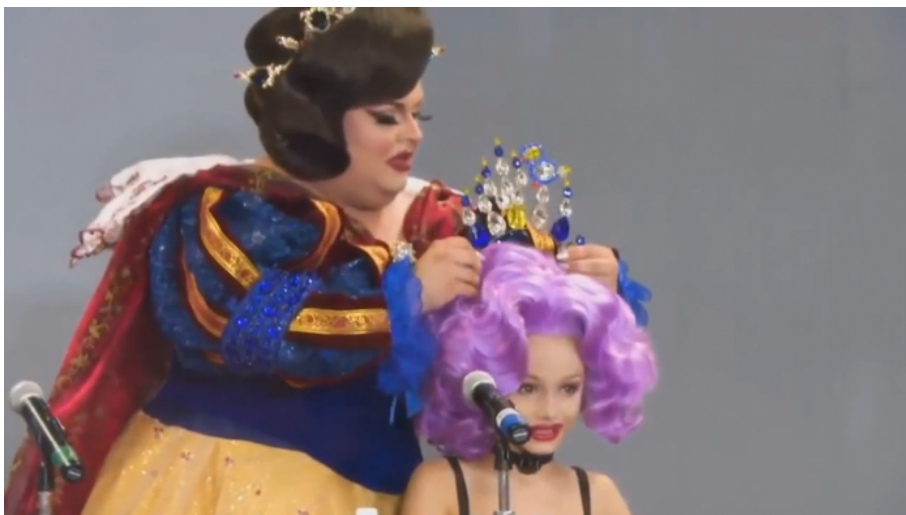
Drag Queen agenda v Kalifornii- Muž převlečený za princeznu a chlapec převlečený za modelku

A to v rámci procesu Euroafriky a kalergiovského procesu The Great Replacement , tedy velké výměny populace Evropy za africký a subsaharský genom. Mezitím bílý muž a bílá žena ztratí roli rodiče a jejich dítě bude indoktrinováno k deviaci a poté přešito na opačné pohlaví, aby se nemohlo množit. První americký stát v USA právě přijal drakonický zákon, který tento proces uzákoňuje. Americký deník The Federalist o tom napsal [1] následující zprávu: