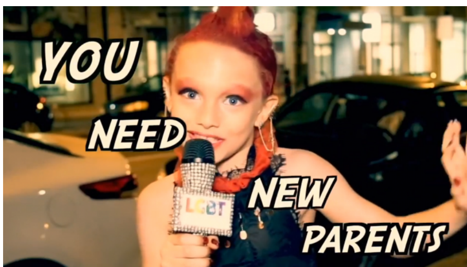
Transgender dítě hlásá v USA svým vrstevníkům, že potřebují nové rodiče

Už doufám chápete, proč je médii indukována nenávist k bílé rase, proč ji nazývají “ toxickou ” a proč chtějí rodinám v Kalifornii odebírat děti, pokud se zjistí, že rodič nechce dítě vystavit eugenickému záření deviance ve škole, do které dítě chodí a ta škola jede na dětech indoktrinační homo/trans/non-bin agendu. Takto zničená rasa se rozmělní a postupně zanikne a ztratí své charakterové a dominantní rysy, které v uplynulých staletích vedly k ukotvení bílé rasy na vrcholu světových civilizací a nejvyššího technologického a sociálního rozvoje. Právě proto Londýnské kanceláře spustily proces Velké výměny v Evropě na bázi 1. a 5. priority, tedy světónázorově-vzdělávací a chemicko-biologické.