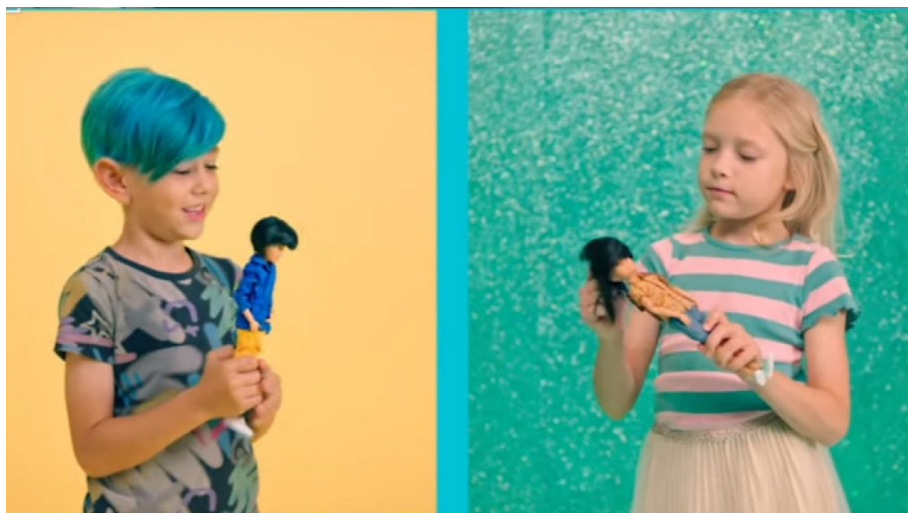
Disneyho transgender pořad pro děti

Co ale má obrovský efekt, to je změna eugenického záření na populaci vlivem médií, školní výchovy a sociálního remodelingu. Proč globalisté prosazují do médií devianty nejrůznějšího charakteru a tlačí je před oči malých dětí dokonce i ve školkách? Proč? Protože nepřítel se snaží o rozbití modelu Svaté Trojice , tedy muže, ženy a jejich plodu, dítěte. Svatá Trojice je odvozena od fyzikálního modelu Teze – Antiteze -> Syntéza . Muž je teze, žena je anti-teze a jejich dítě je syntézou, tedy splynutím opaků muže a ženy v jeden harmonický celek syntézy dvou antagonistů. Globalistický nepřítel se snaží tento princip zničit, zlikvidovat, protože zničením archetypu Svaté Trojice dojde k vymření a zániku bílé rasy.