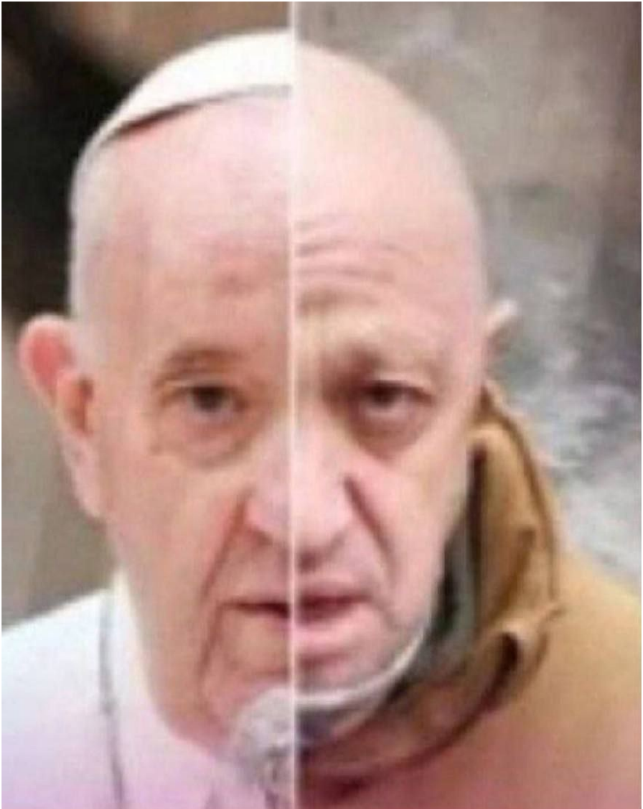
„Papež“ – Prigožin