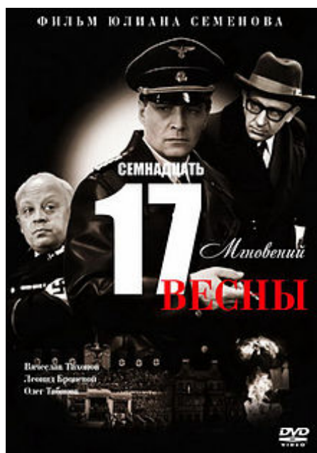
Sedmnáct okamžiků jara (TV film).

Hlavní článek: Yulian Semjonov bibliografie