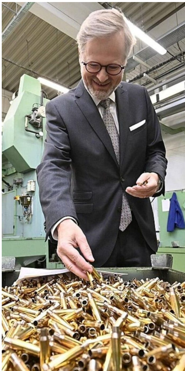
Ve zbrojovce Sellier & Bellot u bedny s nábojnicemi a s výrazem, který nepotřebuje komentář

Polská média přinesla v úterý článek, že Polsko začalo na Ukrajinu vydávat ukrajinské občany, kteří cestují mezi Ukrajinou a Polskem na základě falešných ukrajinských dokladů, které je zbavují mobilizační povinnosti. Ukrajina požádala o jejich vydání, protože jsou na Ukrajině trestně stíháni za využívání padělané listiny a za vyhýbání se mobilizaci. Jenže pozor, tady došlo k určitému nepochopení daného článku [3] z polských médií.