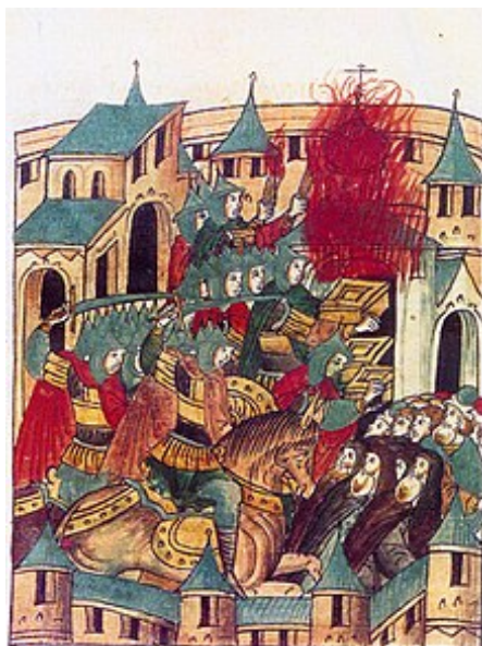
Plenění Suzdalu Bátúem v únoru 1238

Moskevské knížectví vzniklo jako podíl na dědictví vladimirského Alexandra Něvského († 1263), když si Moskvu zvolil sídlo jeho nejmladší syn Daniil . Nové knížectví rychle získávalo moc a Moskva se stala sídlem hlavy pravoslavné ruské církve , když vladimirský „ metropolita Kyjeva a vši Rusi“ Petr Moskevský v roce 1325 přesídlil do Moskvy. Země však byla pod přímým vlivem Zlaté hordy , která vznikla jako důsledek tatarsko-mongolských výbojů. Ruská knížectví musela platit jejím vládcům daň a byla na nich i politicky závislá. Roku 1328 Daniilův mladší syn Ivan I. Kalita od nich získal titul velkokníže moskevský. Roku 1380 využil moskevský velkokníže Dimitrij Donský vnitřních problémů mezi Tatary a porazil Zlatou hordu v Kulikovské bitvě . O dva roky později však zahájili Tataři vítězné tažení proti Rusi a závislost na nich byla v ruských zemích znovu obnovena. Země byla dále roztržena a mezi jednotlivými knížectvími probíhaly rozbroje až do poloviny 15. století.