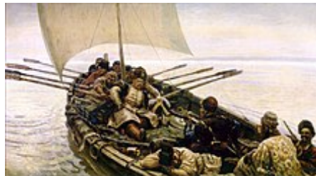
Stěnka Razin na Kaspickém moři

Po smrti Fjodora I. roku 1598 vymřela dynastie Rurikovců, čímž se Rusko dostalo do období rozporů a bojů o carskou korunu, nazývané také jako období smuty . Počátkem 17. století vládl Rusku Boris Fjodorovič Godunov , ovšem roku 1605 se objevil člověk, který se vydával za careviče Dimitrije, syna Ivana Hrozného, který byl již dříve zavražděn. Tento ve skutečnosti chudý šlechtic, který byl později nazván Lžidimitrij I. , byl za účasti Republiky obou národů dosazen na carský trůn. V Rusku poté vypukly rozbroje a roku 1610 obsadila polská vojska Moskvu. Po vytvoření ruského lidového vojska však byla Moskva roku 1612 opět osvobozena. Roku 1613 byl do Moskvy svolán zemský sněm, který zvolil hlavou státu