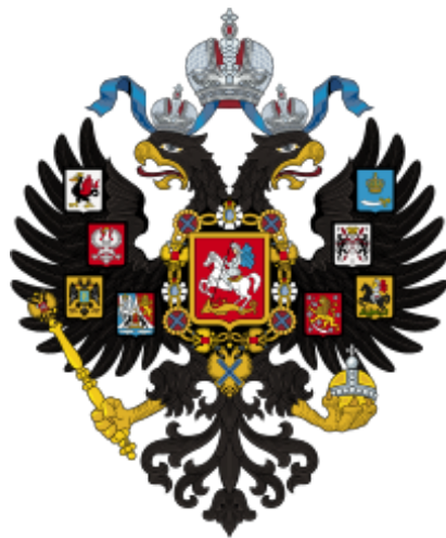
Státní znak Ruského impéria