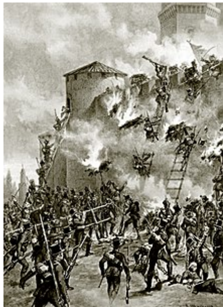
Bitva o Gandžu během rusko-perské války v letech 1804-1813