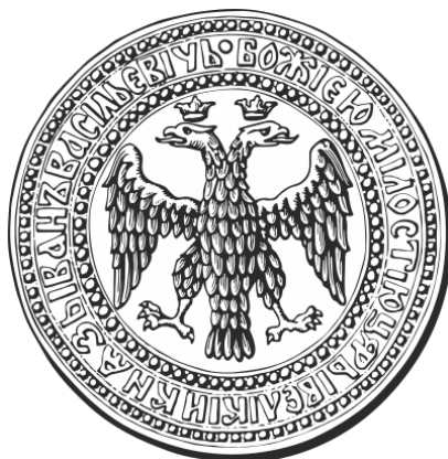
Znak Moskevského velkoknížectví