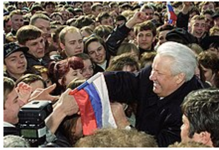
Boris Jelcin , první prezident Ruské federace , během volebního shromáždění v Bělgorodu, 1996