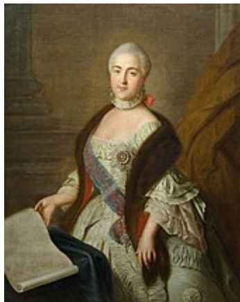
Ruská carevna Kateřina Veliká