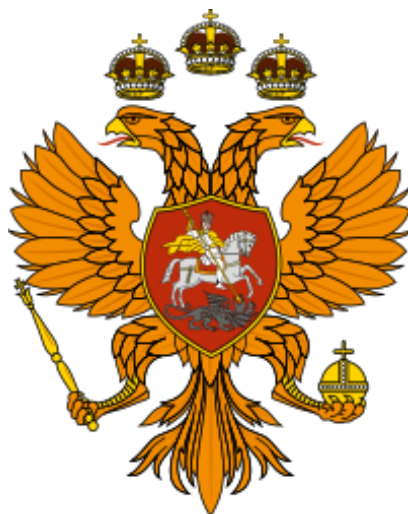
Znak Ruského carství