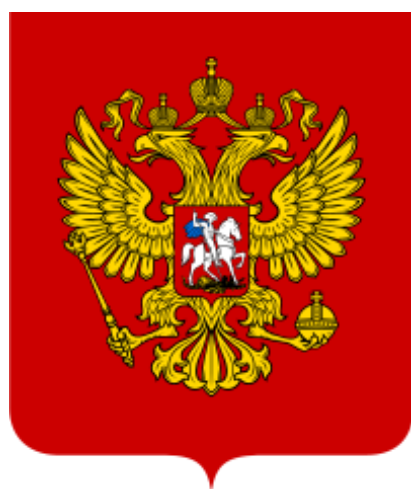
Státní znak Ruské federace

Dějiny Ruska jako státu začínají ve 13. století vydělením moskevského knížectví z knížectví vladimirsko-suzdalského , jednoho z dědiců Kyjevské Rusi zaniklé po vypádu Mongolů . Ruské carství vzniklo roku 1547 , kdy si moskevský velkokníže Ivan IV. Hrozný začal dědičně nárokovat titul car vší Rusi . V roce 1721 za Petra Velikého se Rusko stalo Ruským impériem . Během své historie až do počátku 20. století se Rusko díky výbojům rozrostlo z malého knížectví na mnohonárodnostní imperiální velmoc , rozlohou největší stát světa. Impérium se rozpadlo v důsledku revoluce roku 1917 a navazujících událostí, jeho dědicem se stala Ruská sovětská republika . Ta byla v letech 1922–1991 nejdůležitější svazovou republikou Sovětského svazu (SSSR), který obnovoval ruskou říši