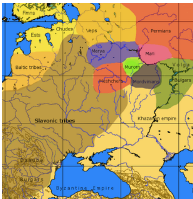
Mapa evropského Ruska v době příchodu Varjagů

Podrobnější informace naleznete v článcích Rozpad Kyjevské Rusi , Ruská knížectví a Vladimirsko-suzdalské knížectví .