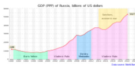
Vývoj ekonomiky Ruska od rozpadu SSSR