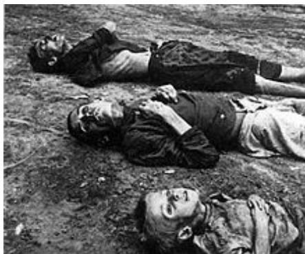
Hladomor v Povolží zabil odhadem 5-6 milionů lidí.

Rusko se na počátku dvacátého století stále potýkalo s řadou problémů. Průmyslový vzestup byl vystřídán krizí v letech 1900–1903. Drtivou většinu půdy drželi stále velkostatkáři, kteří využívali drobné rolníky k levným námezdním pracím, což vedlo roku 1902 k selským nepokojům.