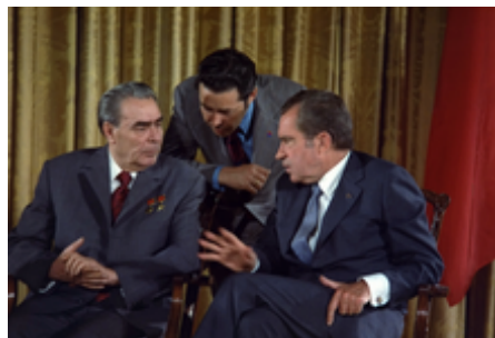
Leonid Brežněv při rozhovoru s prezidentem Nixonem při návštěvě USA

Do roku 1929 země zažívala stálý ekonomický růst na pozadí politického boje uvnitř VKS(b) a Nová ekonomická politika (dočasně umožňující soukromé podnikání) byla postupně opuštěna. Od roku 1930 byla zahájena kolektivizace (které padlo za oběť na 5 milionů lidí [5] ) a industrializace. Do roku 1931 si generální tajemník VKS(b) Stalin fakticky usurpoval moc ve straně, když vytěsnil ostatní členy Politbyra na druhořadé pozice. Zavraždění Sergeje Kirova na konci roku 1934 předznamenalo začátek rozsáhlých stalinských represí .