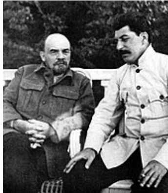
Lenin a Stalin v Gorki (1922)

Související informace naleznete také v článcích Dějiny Sovětského svazu a Sovětské válečné zločiny .