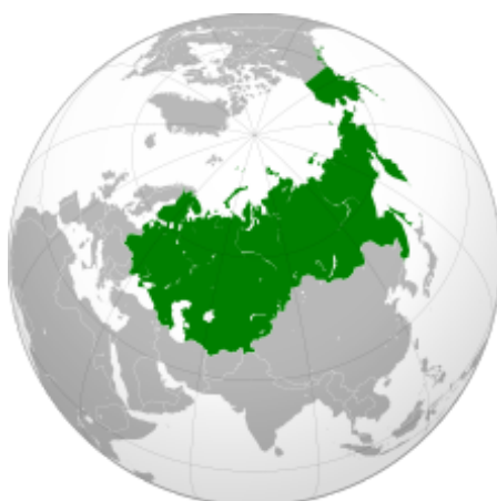
Ruské impérium v roce 1866