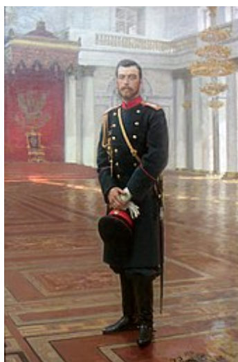
Mikuláš II. , poslední ruský car

Související informace naleznete také v článcích Rusko-japonská válka , Ruská revoluce (1905) , Říjnová revoluce a Ruská občanská válka .