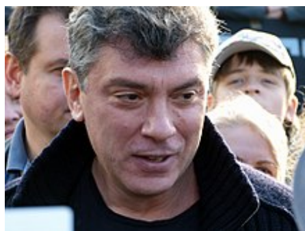
Boris Němcov byl zavražděn 27. února 2015 na mostě poblíž Kremlu