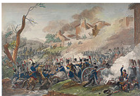
Bitva u Lipska