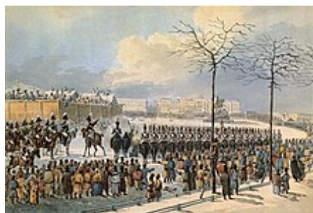
Děkabristé na Senátním náměstí