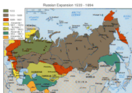
Expanze Ruska mezi lety 1533–1896

Související informace naleznete také v článku Ruské impérium .