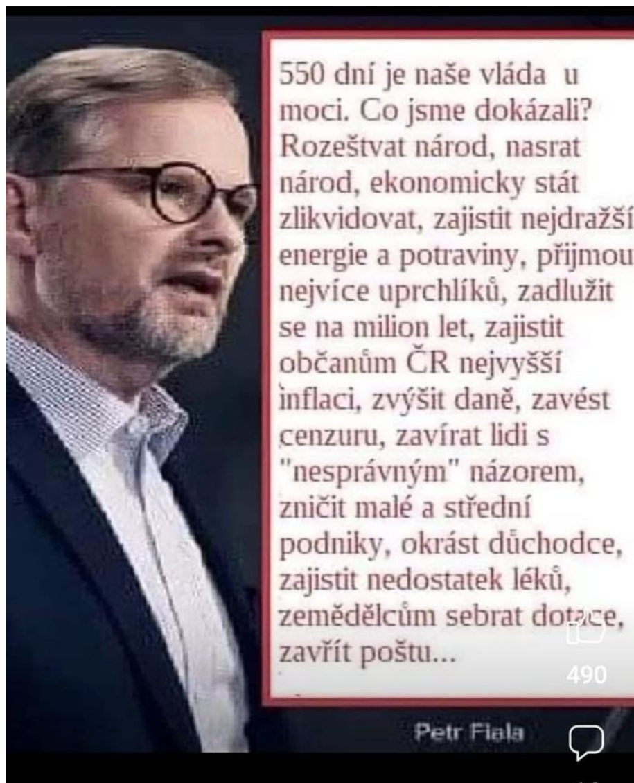
Co dokázala Fialova vláda za 550 dní

A co se zbytkem Čechů? Dopadne to jako v USA. Když Američané nemají práci, jdou pracovat pro strýčka Sama, to znamená vstup do armády, podepsání kontraktu. Češi zatím nezaměstnanost takto řešit nemuseli, ale brzy to přijde. Češi bez práce se začnou hlásit do české armády. Ne kvůli lásce k zelenému životu, ale kvůli vysokému platu a hlavně kvůli výsluhám. Ty mohou dosáhnout v případě vojáků zahraničních misí po pouhých 20 letech v řadách AČR až 55% průměrného měsíčního platu [3]. Přitom na starobní důchod musí český gój pracovat 35 let! To je 1,5x déle!