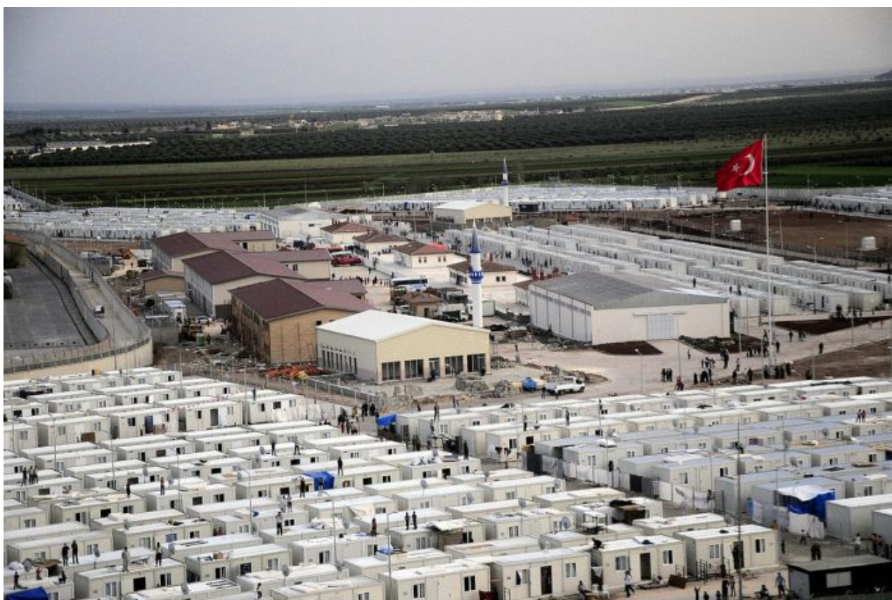
Uprchlický tábor v Turecku vybudovaný z peněz EU pro syrské migranty

Zamyslete se sami: Kdyby na Ukrajině bylo nebezpečno, jezdily by tam výletní vlaky českých drah? A jezdily by tam ukrajinské matky se svými dětmi? Odpověď je logická a jasná. Samozřejmě, že ani omylem a ani náhodou. Pokud by na západní Ukrajině byl stav podobný válce, tedy nebezpečná zóna, nejezdily by tam ani české vlaky, ani ukrajinské maminy s dětmi. Jinými slovy, je načase, aby Ukrajinci opustili Evropskou unii a vrátili se zpátky na Ukrajinu, minimálně do západní části.