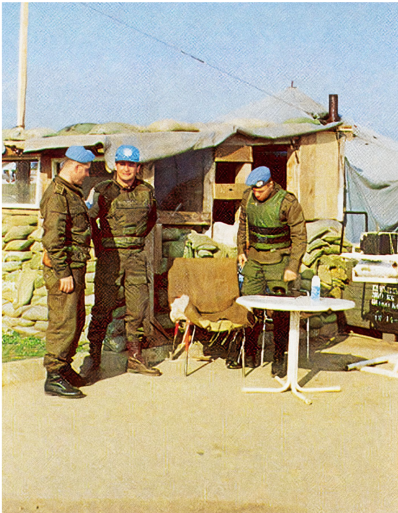
Checkpoint Ličko Petrovo selo. Nedatovaný snímek z dob působení UNPROFOR na území bývalé Jugoslávie.