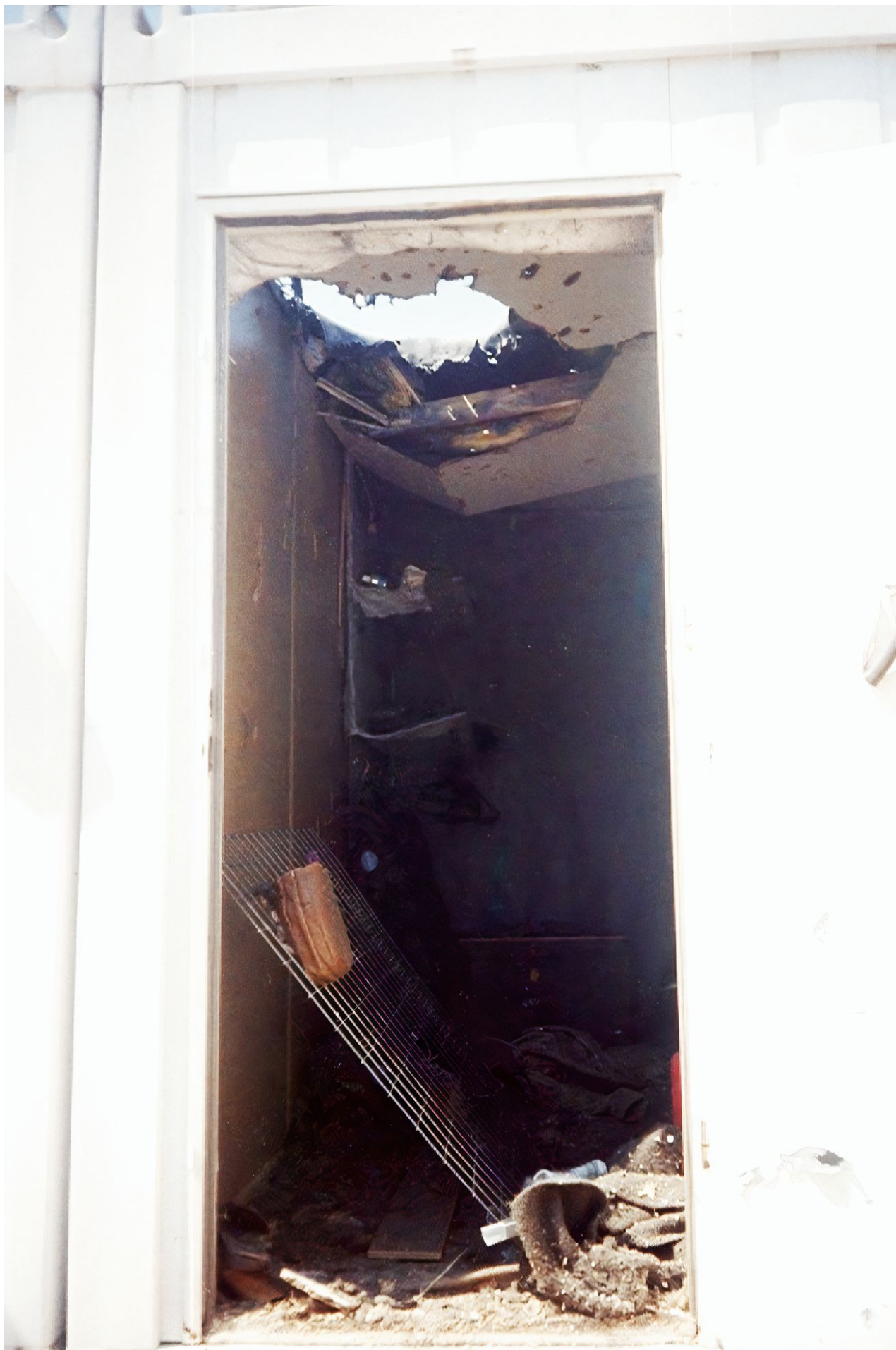
Jedna z obytných buněk zasažená granátem. Nedatovaný snímek.