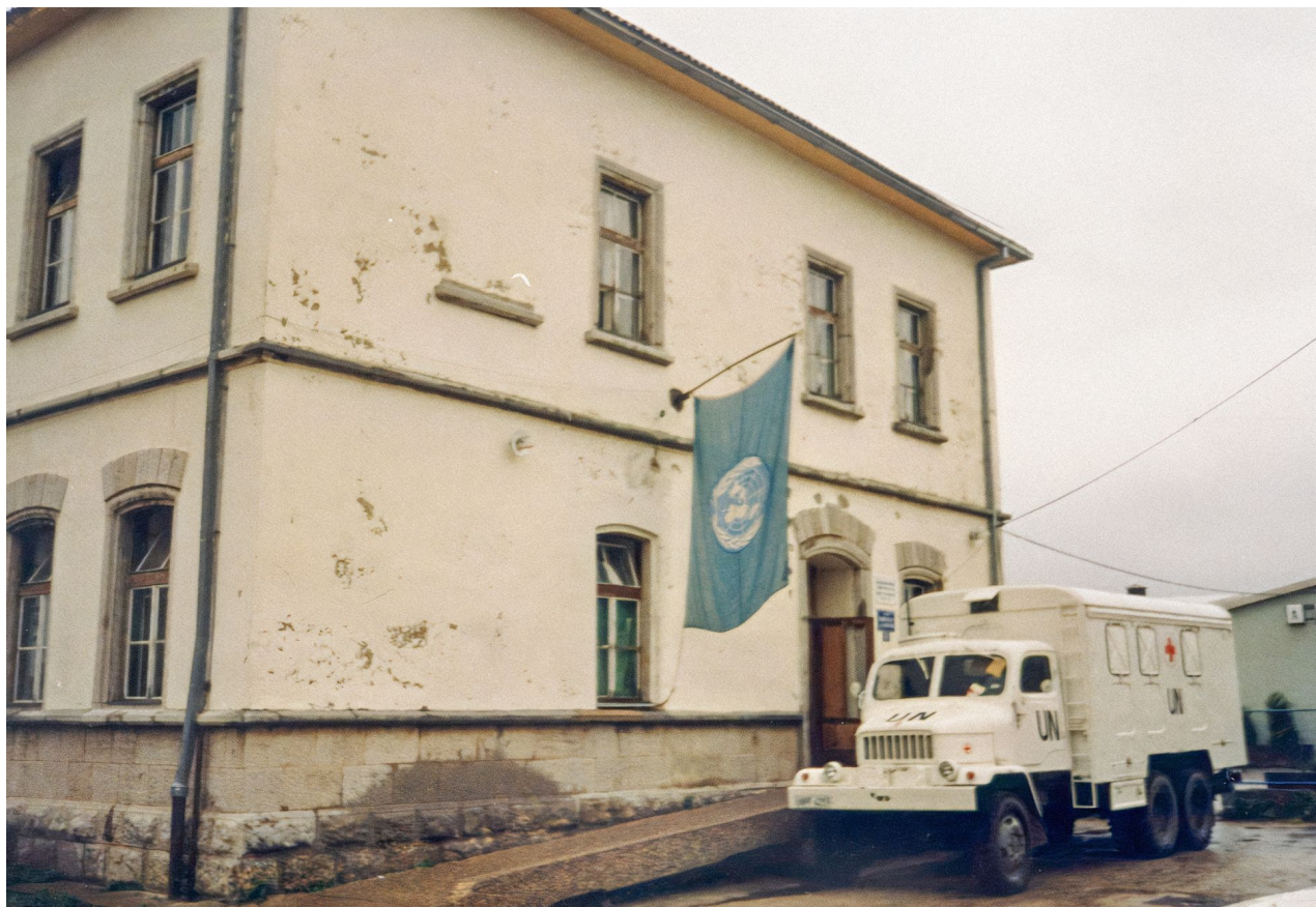
1992 - Český štáb 3. roty rychlého nasazení v misi UNPROFOR.