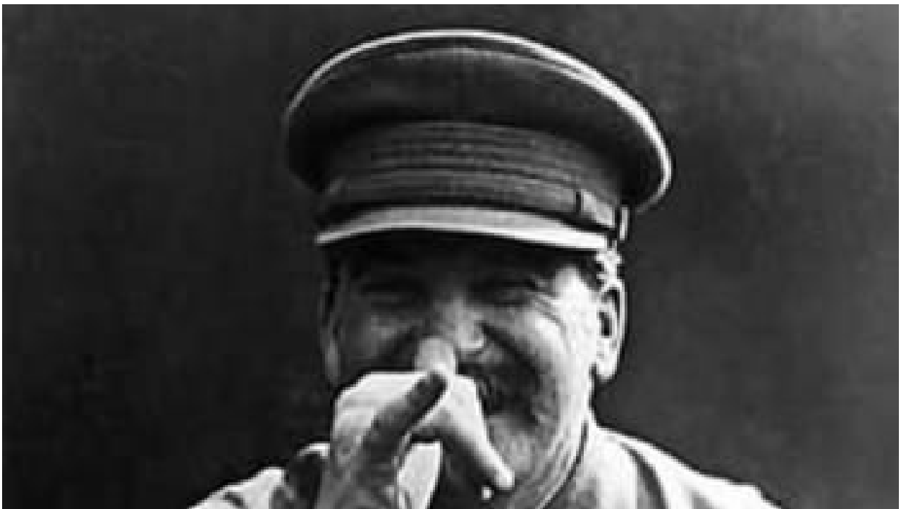
Operace Nemyslitelné: Stalin

Roosevelt nepřipouštěl v politických debatách rozdělení osvobozené Evropy do politických sfér vlivu, jenže přesně to se s postupem Rudé armády na západ dělo a Churchill to dokázal rozpoznat. Rozzuřovala jej Rooseveltova blahosklonnost k Stalinovi a tendence bolševickému vůdci vycházet ve všem vstříc, přestože sovětské okupační správy v obsazených zemích nedodržovaly úmluvy z Jalty, že se spojenci nebudou míchat do místních politických poměrů.