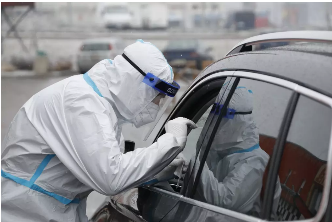
Testování na koronavirus. Ilustrační foto

Virolog Stuart Turville ze Sydneyské univerzity podle listu The Washington Post označil Eris za „konkurenceschopnější“ ve srovnání s ostatními variantami koronaviru. „Umí o něco lépe vstupovat do buněk,“ vysvětlil.