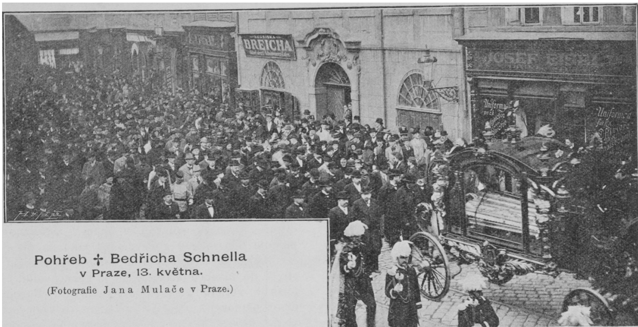
Pohřeb † Bedřicha Schnella v Praze, 13. května.