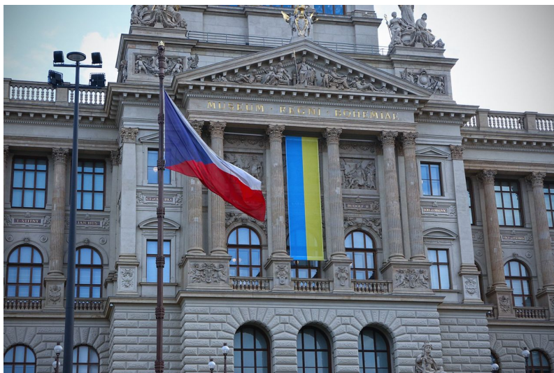
Znesvěcení národního symbolu budovy vlajkou státu, který po roce 2014 rehabilituje a oslavuje válečného zločince Stěpana Banderu, jehož oddíly v letech po roce 1945 terorizovaly a zabíjely občany Československa

Konce válek přináší vždy katarze a změny. A plánem Moskvy je velká katarze Evropy. Je načase! Současné evropské protilidové vlády musí postupně skončit, a to tím nejlepším způsobem, ztratí veškerou důvěru a podporu lidu. A oni to vědí. Proto se snaží všemožně válku na Ukrajině prodlužovat, protože dokud bude válka trvat, budou politici stále moci odvádět pozornost od své neschopnosti a vlastizrádnosti směrem k válce. Dokud bude válka trvat, bude pokračovat ukrajinizace ČR bez omezení. Ukrajinci budou úplně všude. Ukinda sem, Ukinda tam! Jenže s příchodem konce války pomáží Ukindy domů, a politici to vědí.