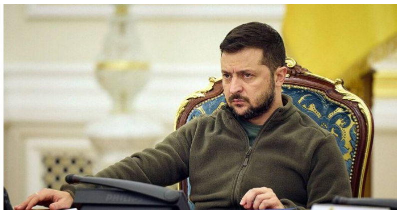
Volodymyr Zelenský, vůdce kyjevské teroristické junty

Divná speciální operace má tak divná pravidla, že i Zelenský vede válku divně a místo na Ruskou armádu útočí na civilní bytovky v Doněcku a na mosty na Krymu. Ukrajinská armáda nemá jinou možnost, než se transformovat do guerillové armády s cílem provádění terorismu v Rusku. Guerillová armáda sestavená ze zbytků AFU a pod velením Azováků. To je ten plán, který má Kyjev. Teror budou řídit Azováci, kteří pod sebe dostanou části zbytků ukrajinské armády. Bomby a rakety začnou padat brzy i na Moskvu. To je naprosto jisté. Otázkou bude, jestli Putin dostane od Moskevských kancelářů povolení k sundání kyjevské junty. To je jediná cesta, která vede k ukončení války.