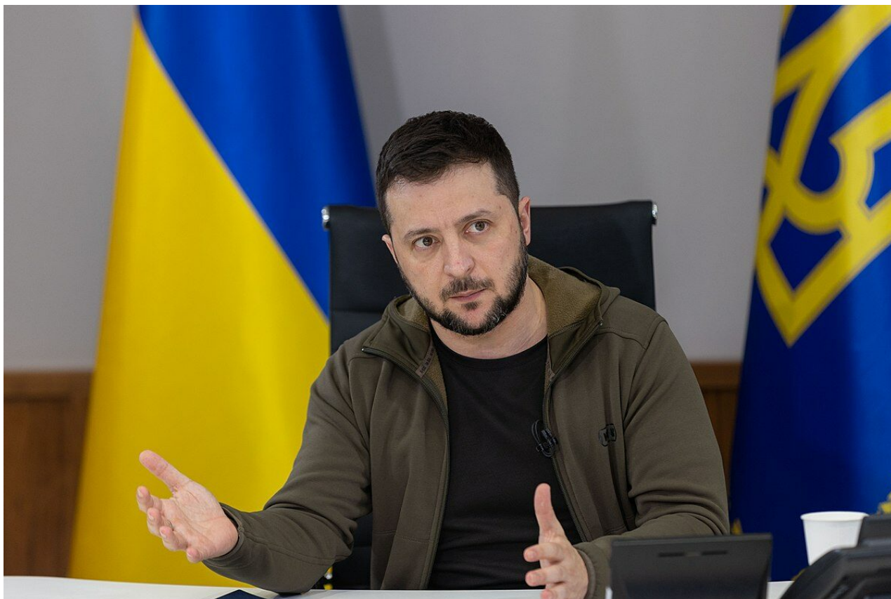
Ukrajinský prezident Volodymyr Zelenskyj

FORUM 24 forum24.cz/zelenskyj-otevrene-promluvil-o-moznem-cili-ofenzivy-rekl-jak-primet-putina-k-jednani