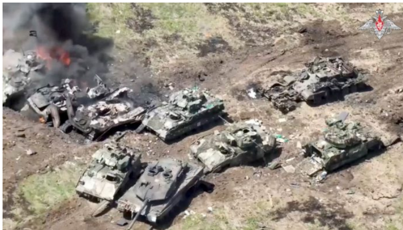
Zničený Leopard 2A6 a americké BVP Bradley v Záporožském směru

Proto ukrajinská armáda se za měsíc od spuštění ofenzívy nepohnula z místa. Propagandisticky došlo k obsazení vesnice Neskučnoje, která leží v šedé zóně nikoho uprostřed mezi ruskými a ukrajinskými zákopy. Jenže, to nebyl cíl ofenzívy. Ten spočíval v dobytí města Melitopolu, což by otevřelo cestu k Mariupolu a ke Krymu. A tento cíl se naplnit nepodařilo. O situaci byly informovány špičky NATO a co se bude dít dál, to ukáže summit NATO ve Vilniusu, který se bude konat 11. a 12. července. Poláci už podle posledních informací startují motory tanků a chystá se invaze polské armády na Volyň na západní část Ukrajiny. Informaci uvedl [1] ruský politolog Sergej Iščenko. Níže je ukázka z jeho článku.