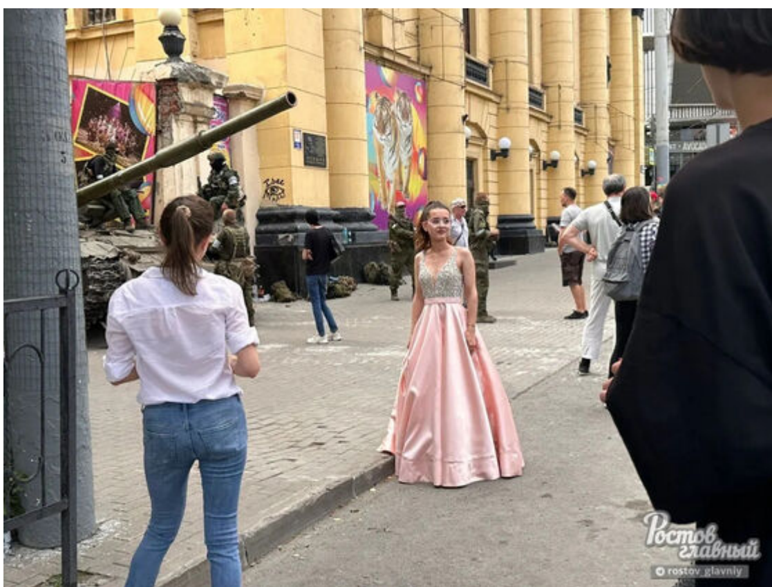
T-72 je dokonalým příslušenstvím

Koncem pátku se v Rostově (s červeným označením Z) objevily ozbrojené konvoje Wagnera , které ovládly několik vojenských úřadů, což se rovnalo nekrvavému převratu ve městě. Scény byly poněkud obskurní – tanky v ulicích města a bezpečnostní kordony kolem klíčových objektů, ale zdánlivá lhostejnost obyvatelstva. Lidé se vmísili mezi Wagnerovy vojáky, metaři se věnovali své práci, Wagnerovi vojáci si kupovali cheeseburgery a lidé se fotili s tanky.