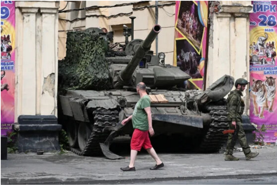
Nemůžeš tam zaparkovat, kamaráde

Pak se Wagnerův sloup zastavil. Běloruská vláda oznámila, že s Prigožinem a Putinem byla vyjednána dohoda. Lukašenkův úřad tvrdil, že „dospěli k dohodám o nepřipustnosti rozpoutání krvavého masakru na území Ruska“. Kolona odbočila z cesty na Moskvu a vrátila se do Vagnerových polních táborů po Ukrajině a Vagnerovy jednotky ponechané v Rostově se sbalily a odjely. Kromě posádek dvou sestřelených letadel nebyl nikdo zabit.