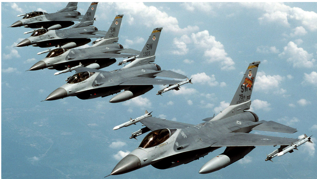
Obraz: stíhačky F-16. Soubor obr

Ukrajina potřebuje moderní letectvo, ne letku nebo tak ojeté platformy F-16, které nejsou ani únosné, ani důvěryhodné, proti moderním, kradmým ruským stíhačkám.