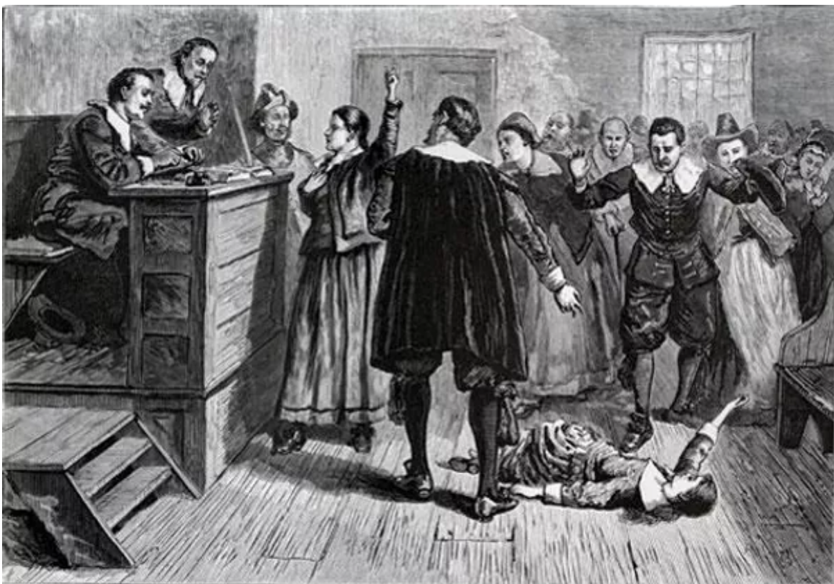
WITCHCRAFT AT SALEM VILLAGE

Zatkli nejen je, ale i některé příbuzné, sympatizanty a pochybovače. Do vězení byla poslána i čtyřletá dcera Sarah Goodeové, která řekla: "Jsem také čarodějnice." Nechtěl jsem být odloučen od své matky.