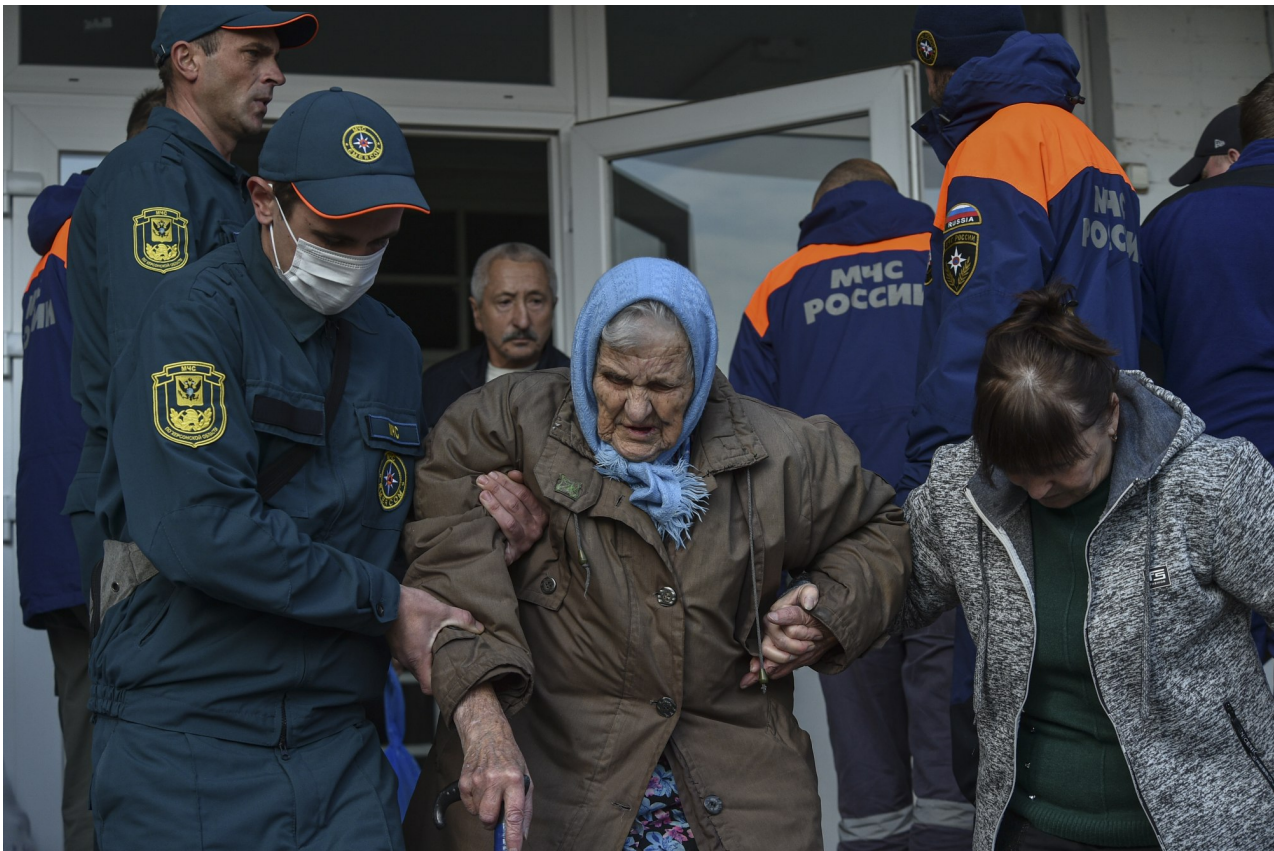
Ruští záchranáři pomáhají v sobotu evakuovat obyvatele geriatrického penzionu na levém břehu řeky Dněpr v Chersonu.

Jak Rusko, tak Ukrajina od října opakovaně obviňují oba z plánování prolomení přehrady pomocí výbušnin, což by zaplavilo velkou část oblasti po proudu řeky, což by pravděpodobně způsobilo velké zničení kolem města Cherson.