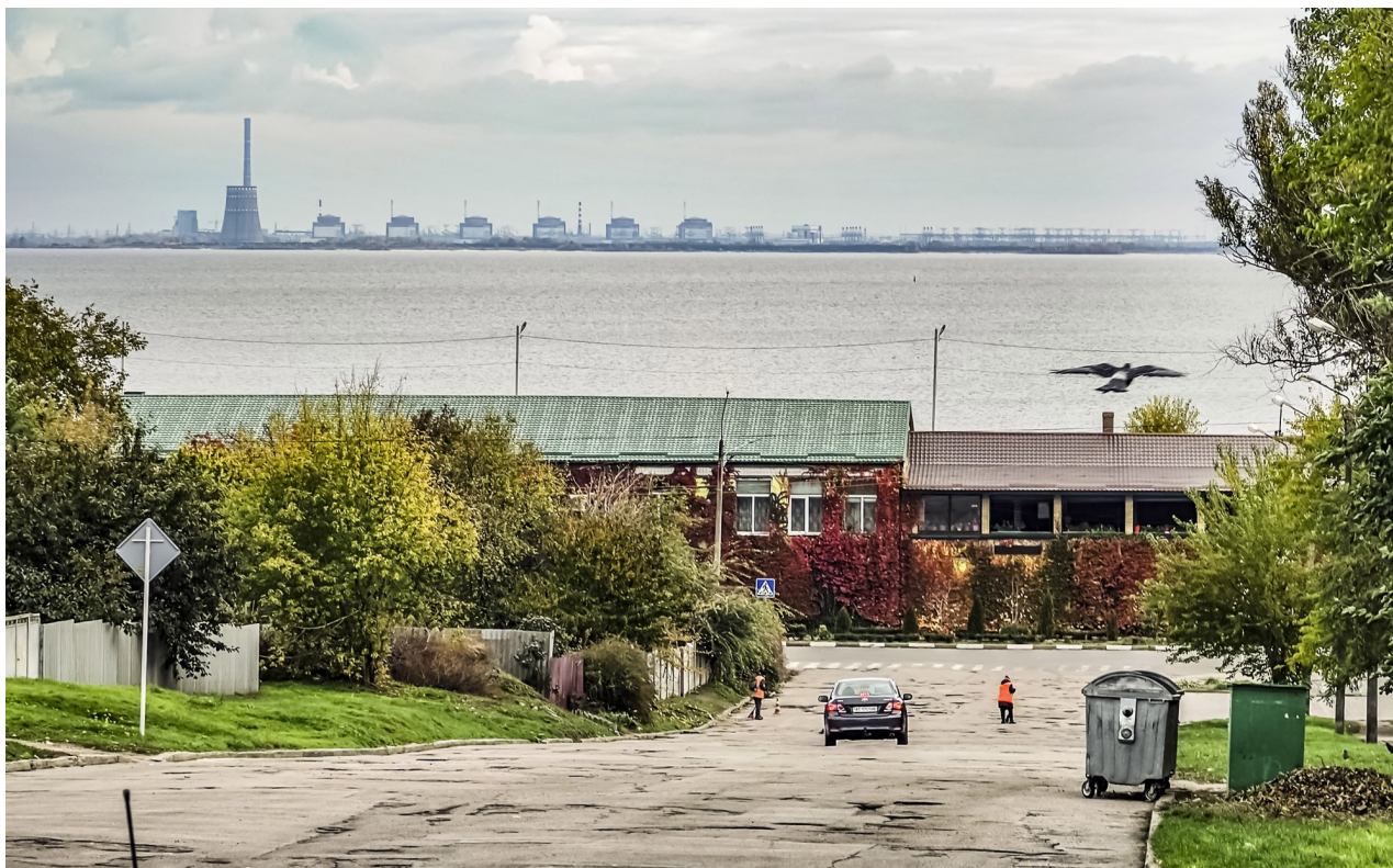
Jaderná elektrárna Záporoží je vidět z Nikopolu na Ukrajině v říjnu 2022.

Dříve v sobotu Mezinárodní agentura pro atomovou energii (MAAE) uvedla, že v Ruskem okupované jaderné elektrárně Záporoží na jihu Ukrajiny bylo obnoveno vnější napájení.