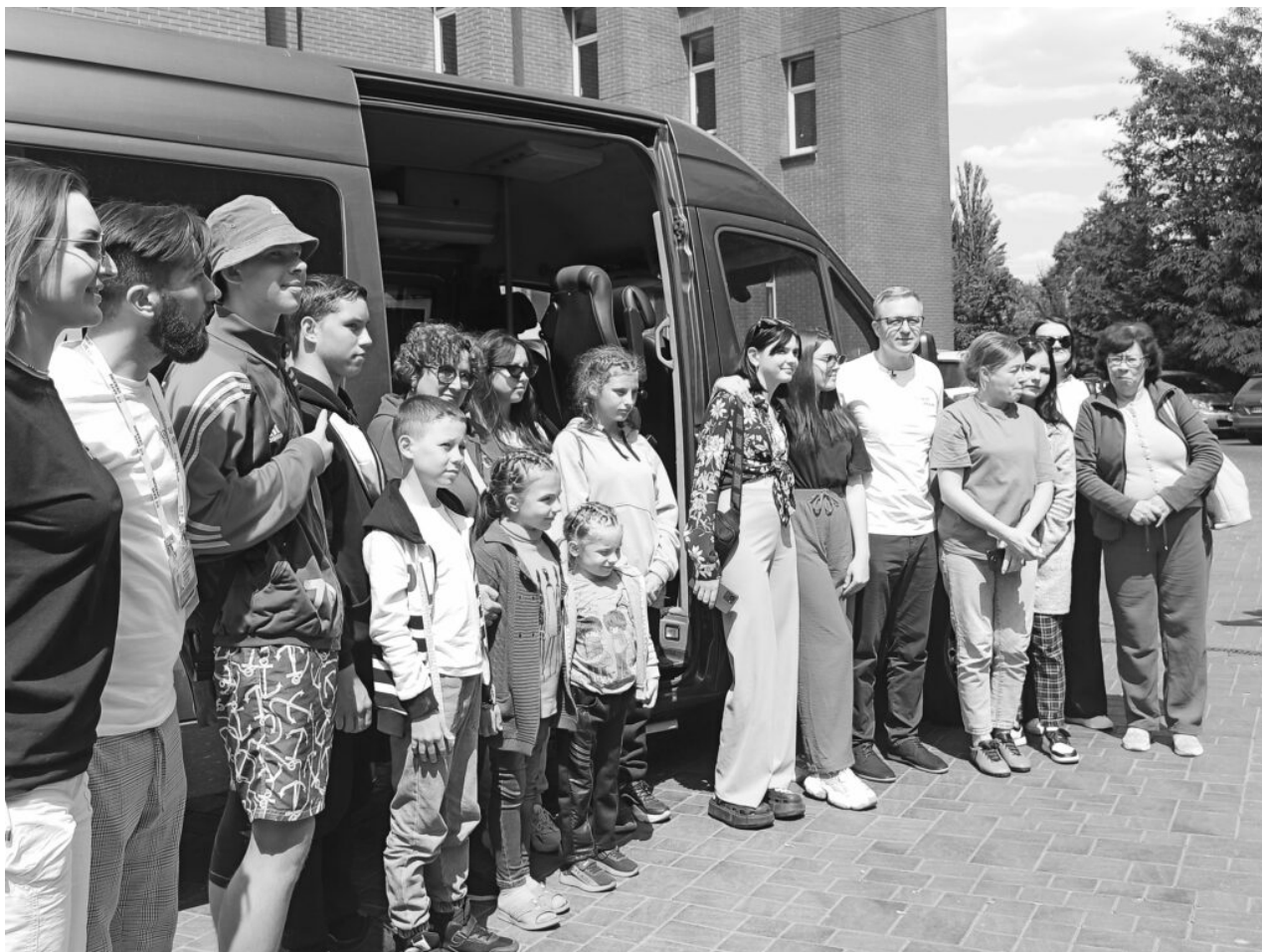
Zachráněné děti pózují na společné fotografii se svými rodiči a dobrovolníky Save Ukraine před dodávkou, která je přivezla do Kyjeva