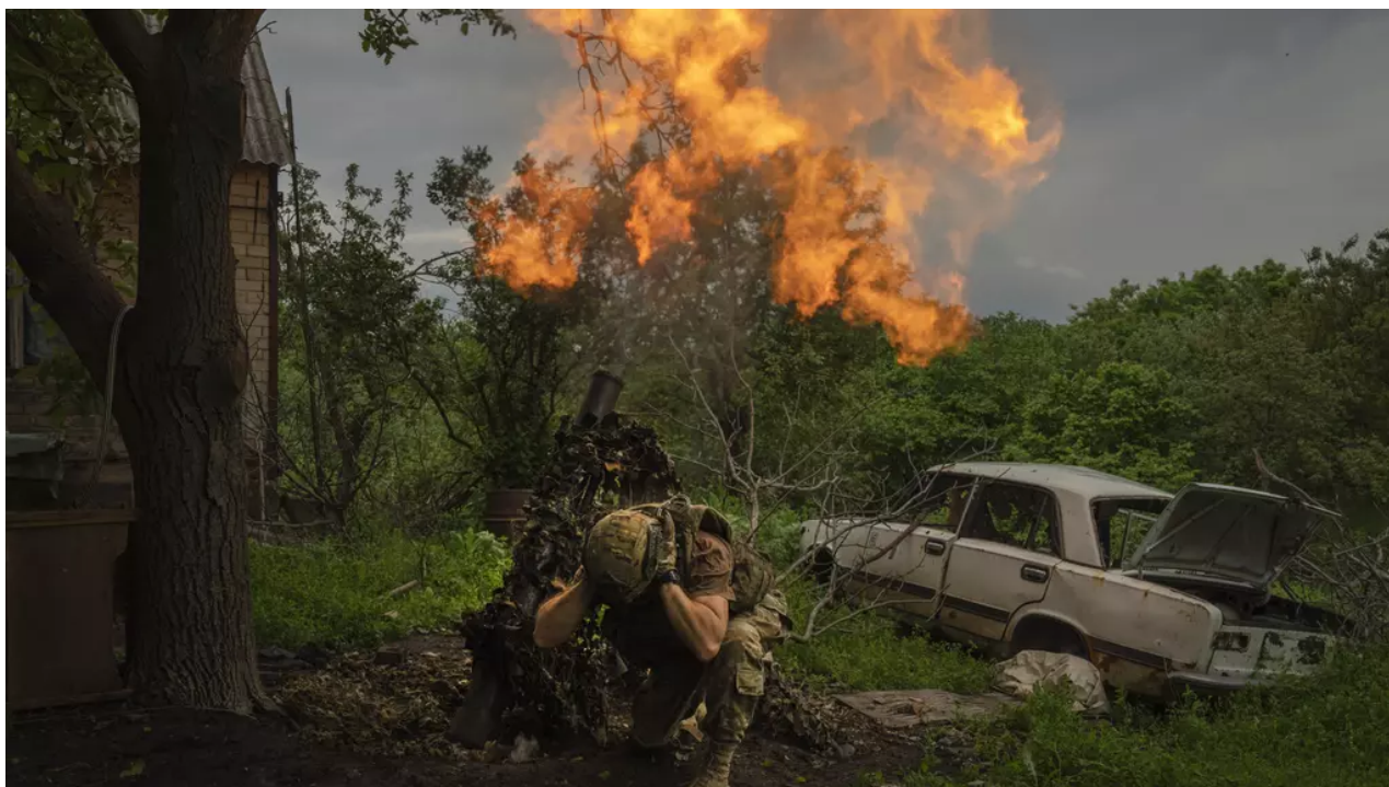
Ukrajinský voják u Bachmutu (archivní foto)

Ukrajina podle britské vojenské rozvědky v některých místech fronty za uplynulé dva dny prolomila první ruskou obrannou linii, jinde je pokrok menší. Podle amerického Institutu pro výzkum války (ISW) ukrajinská armáda v pátek pokračovala v protiofenzivě na nejméně čtyřech místech fronty.