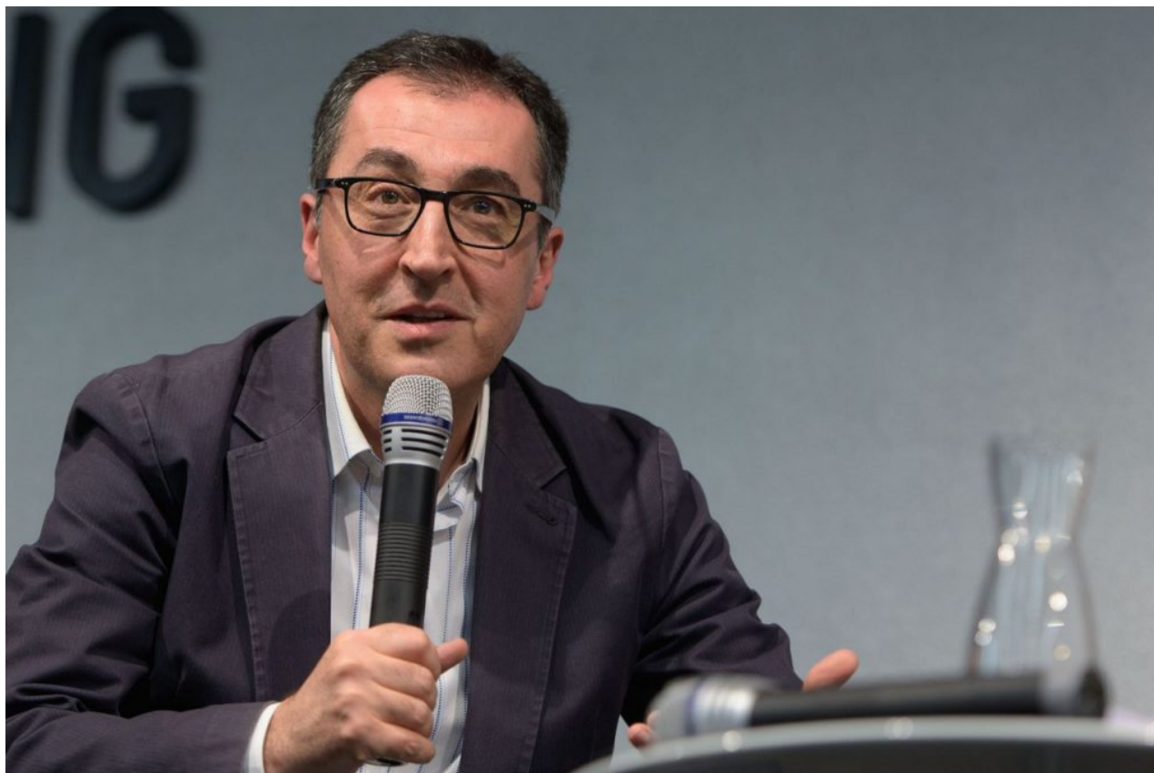
Cem Özdemir, ministr zemědělství

Ministr zemědělství Cem Özdemir má proto implementovat požadavky DGE do nové výživové strategie. Dokument o klíčových otázkách „ Cesta k výživové strategii federální vlády “ přijal kabinet v prosinci 2022. Do konce roku 2023 má být strategie přijata. A k čemu ta strategie bude? No přece k přijetí zákonů a podmínek pro čerpání dotací. Kdo se nebude řídit certifikátem DGE, nedostane dotace i pro ty věci, na které dosud dotace dostal.