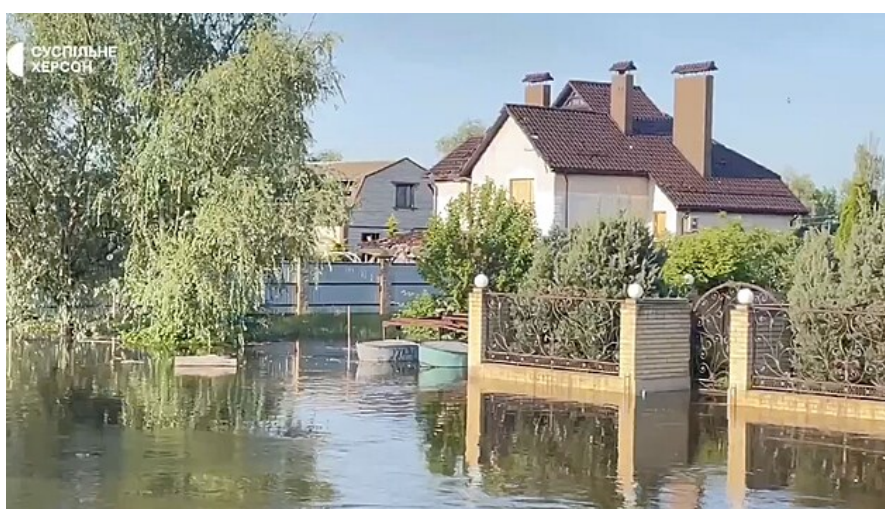
Záplavy v Chersonské oblasti po odpálení Kachovské přehradě na Dněpru (6. června 2023)