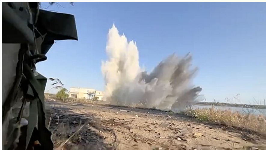
Ze zničení Kachovské přehradě se navzájem obviňují Rusové a Ukrajinci (6. června 2023)