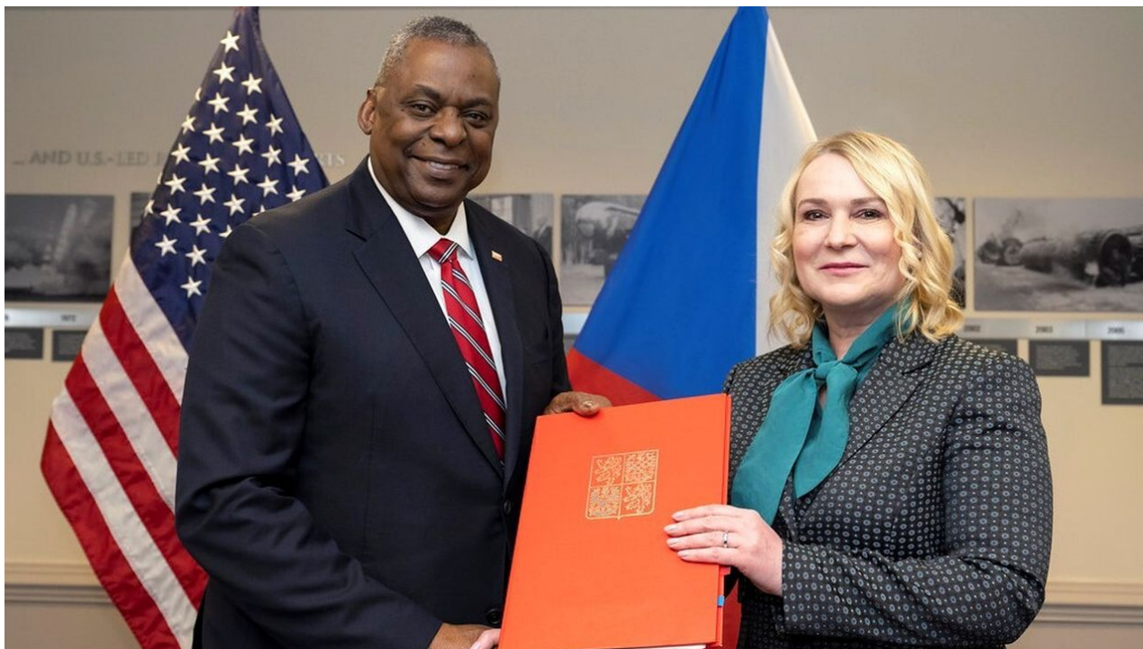
Ministři obrany USA a ČR, Lloyd Austin a Jana Černochová po podpisu zvacího dekretu pro rozmístění amerických vojsk v ČR

Přičemž na území ČR budou moci být rozmístěni američtí vojáci, kteří budou spolu s českými vojáky cvičit a chystat se na střet s Ruskou armádou, jak prozradil Řehka a pokud dojde na výzvu Pekarové, tak kromě rozmístěných amerických vojáků se ČR a Slovensko dočkají i rozmístěných jaderných zbraní!