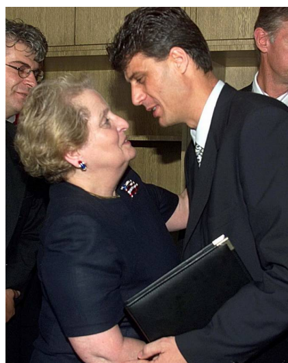
Hashim Thaci a M. Albrightová