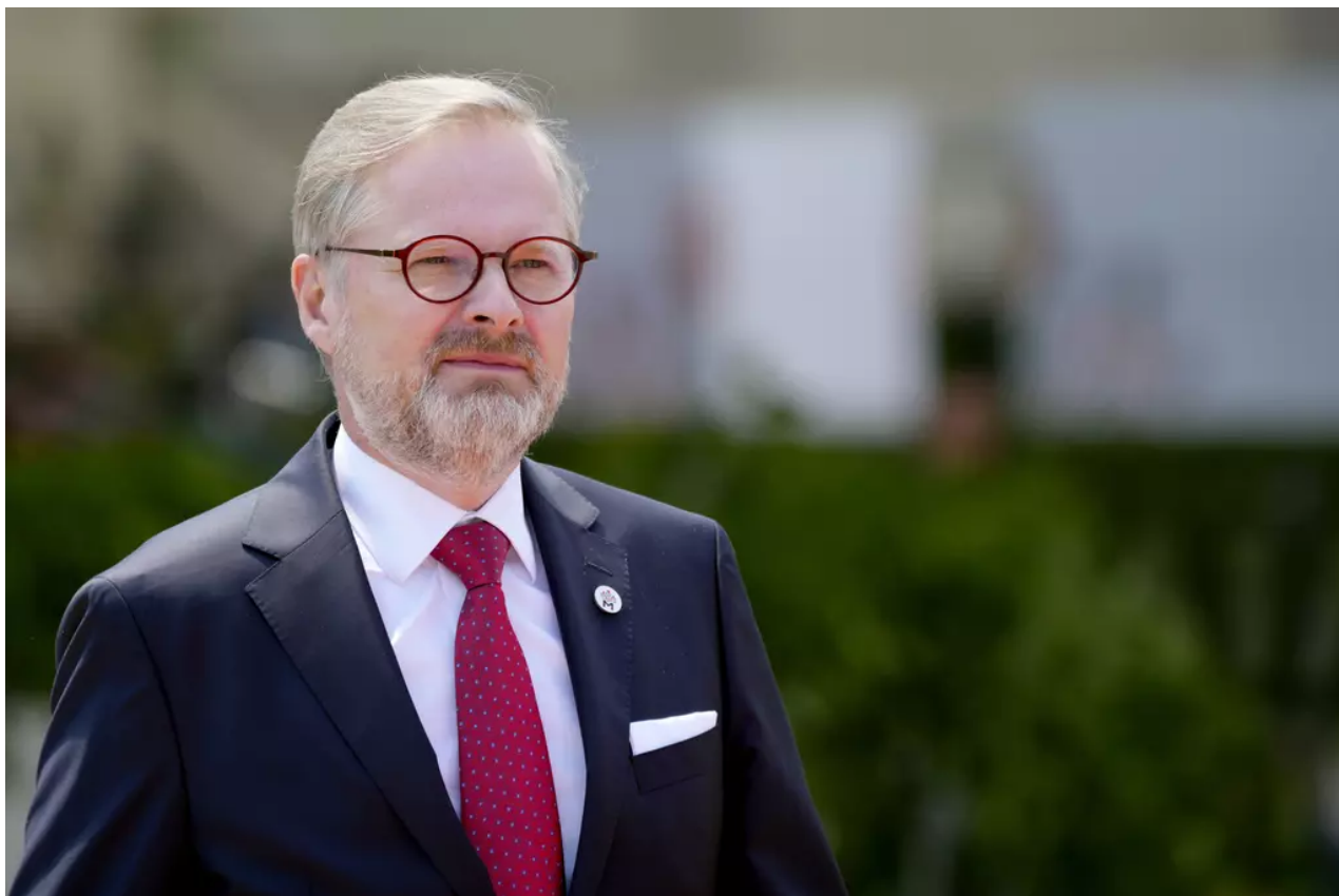
Premiér Petr Fiala na summitu EPC v Moldavsku

Summitu na zámku nedaleko ukrajinské hranice se účastní více než 40 evropských vůdců, jsou mezi nimi i francouzský prezident Emmanuel Macron či německý kancléř Olaf Scholz. Česko zastupuje premiér Petr Fiala (ODS), který má podle oddělení komunikace předsedy vlády mimo jiné v plánu bilaterální schůzky se svým gruzínským protějškem Iraklim Garibašvilim, srbským prezidentem Aleksandarem Vučićem nebo s německým kancléřem Scholzem. Sejit by se mohl i se Zelenským.