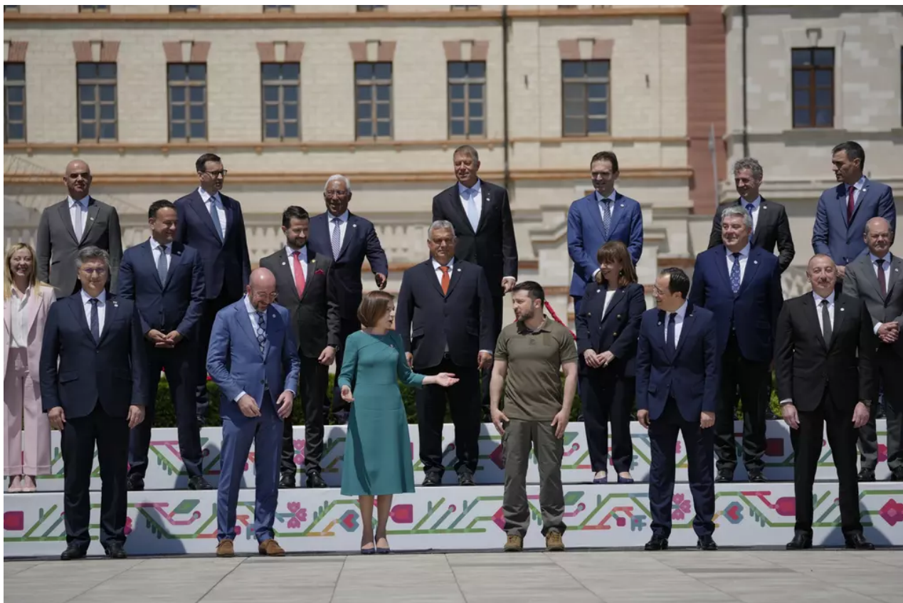
Evropští lídři na summitu EPC v Moldavsku

Za třetí krok pak Zelenskyj označil vstup Ukrajiny do NATO a EU. „Na (červencovém) summitu NATO (v litevském Vilniusu) by měla být jasně stanovena cesta ke členství a měly by být schváleny bezpečnostní záruky. Na podzim by měla začít jednání i na půdě EU,“ nastínil svou představu Zelenskyj. Vyjádřil přitom přesvědčení, že v dlouhodobém horizontu vstoupí do EU nejen Moldavsko či Gruzie, ale také Bělorusko.