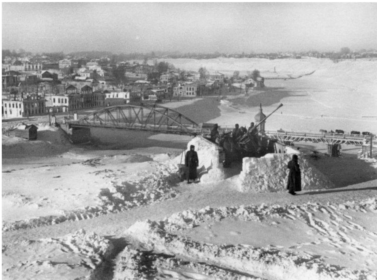
Němečtí protiletadloví dělostřelci u mostu přes Volhu v okupovaném Rževu. Zima 1942. Uprostřed je německé protiletadlové dělo FlaK 37 ráže 37 mm.