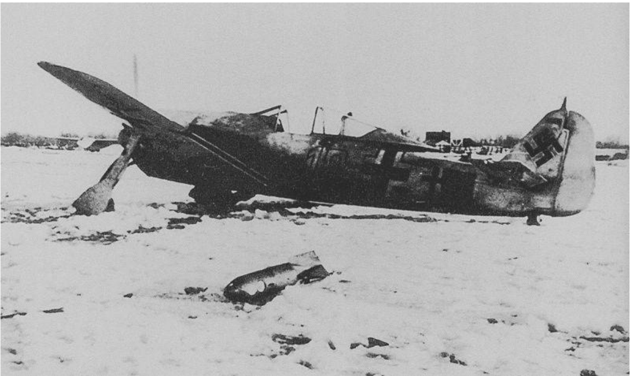
Zničena německá stíhačka Focke-Wulf Fw.190A na letišti v Brjansku.

7. a 19. března se 16. armáda opět pokusila prolomit nepřátelskou obranu a dosáhla místních úspěchů. Byla ale připravena o 9. tankový sbor, který byl převelen do jiného sektoru fronty, a Baghramjanova armáda nemohla dosáhnout úspěchu. Němci vytáhli další tři divize a dobyli zpět řadu pozic. ZF konečně přešla do defenzívy.