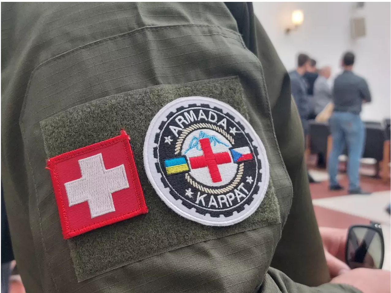
Foto: Jan Novák, Seznam Zprávy S Taylorem se přišli rozloučit i jeho ukrajínští přátelé.

„Výukou taktické medicíny, ošetřováním a odvážením zraněných zachránil spousty životů. Nazýval to svou soukromou válkou s Putinem. Věděl, že tím brání demokracii tady u nás, a věděl, že zlu se nesmí ustupovat,“ líčí máma, které Rusové zabili syna.