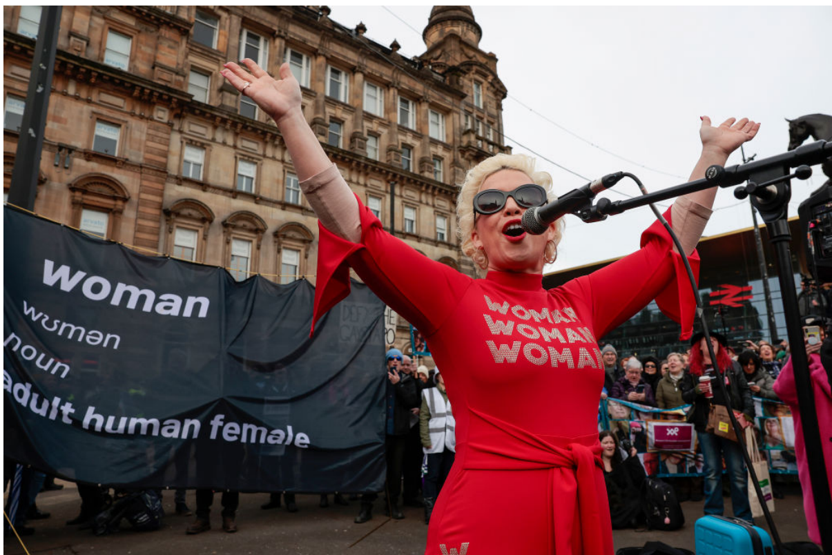
Kellie-Jay Keen-Minshullová (Posie Parkerová) hovoří během protestu Standing for Women ve skotském Glasgow 5. února 2023.

Komentáře Devesové následovaly poté, co se v Austrálii a na Novém Zélandu konaly agresivní proti-protesty proti shromážděním „Nechte ženy promluvit“ pořádané britskou bojovnicí za ženská práva Kellie-Jay Keen-Minshullovou (známou také jako Posie Parkerová).