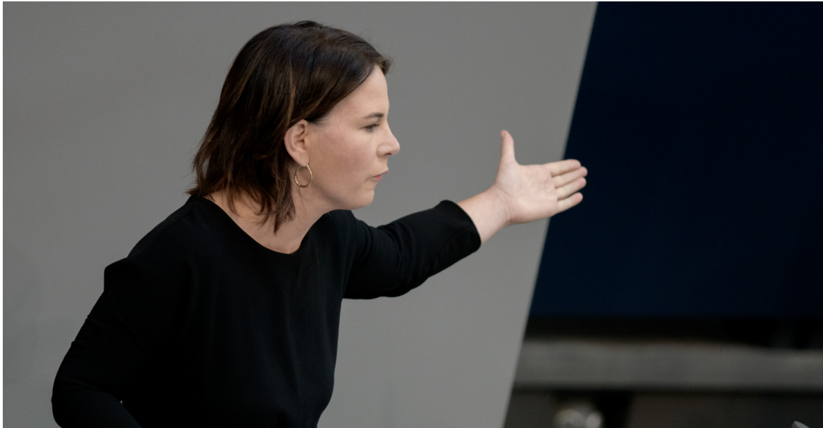
Ministryně zahraničních věcí Německa Annalena Baerbocková.