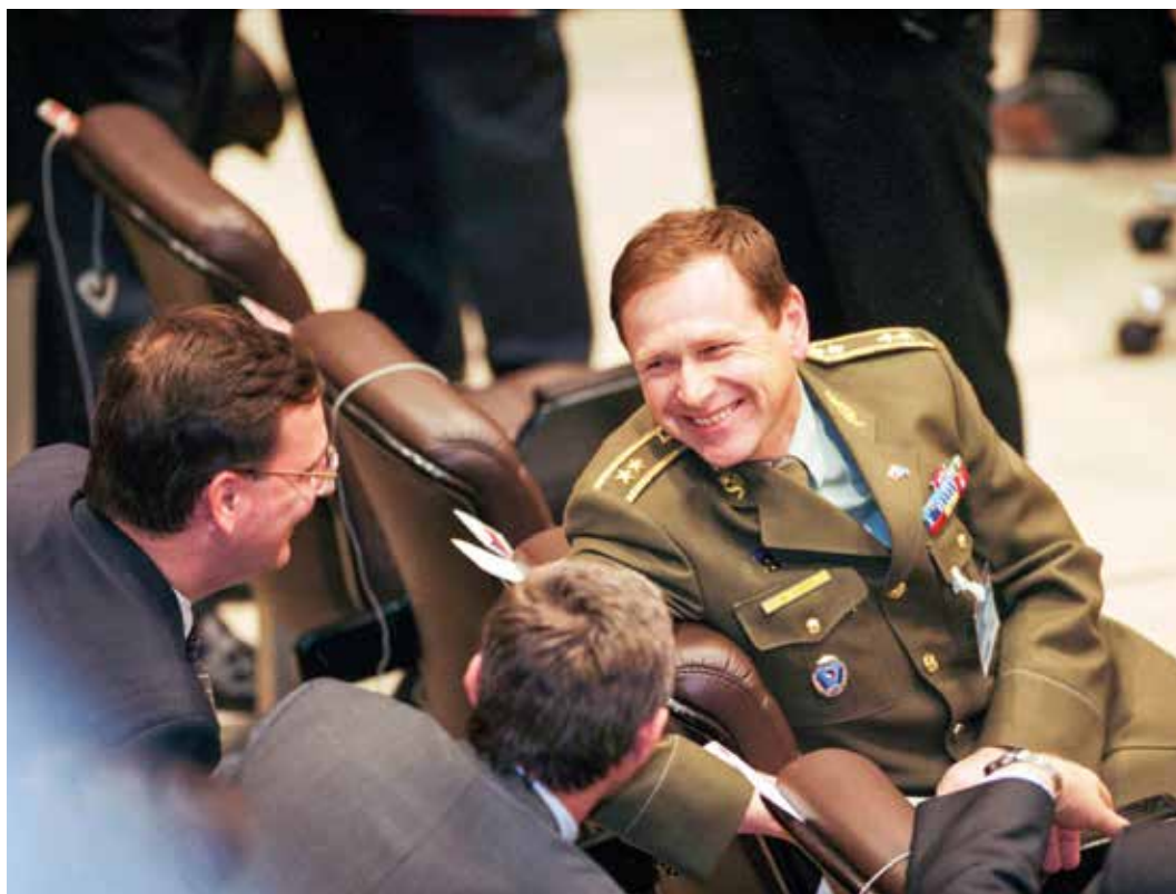
Náčelník Generálního štábu AČR generál Jiří Šedivý v sídle politického ústředí Severoatlantické aliance v den, kdy byly slavnostně vztyčeny vlajky tří nových členských zemí NATO – České republiky, Polska a Maďarska (březen 1999).

Nepochybně. I kdyby měla Česká republika třikrát větší armádu, nebyla by schopna se samostatně ubránit. Podstatné je naše členství v NATO a malá, ale funkční armáda.