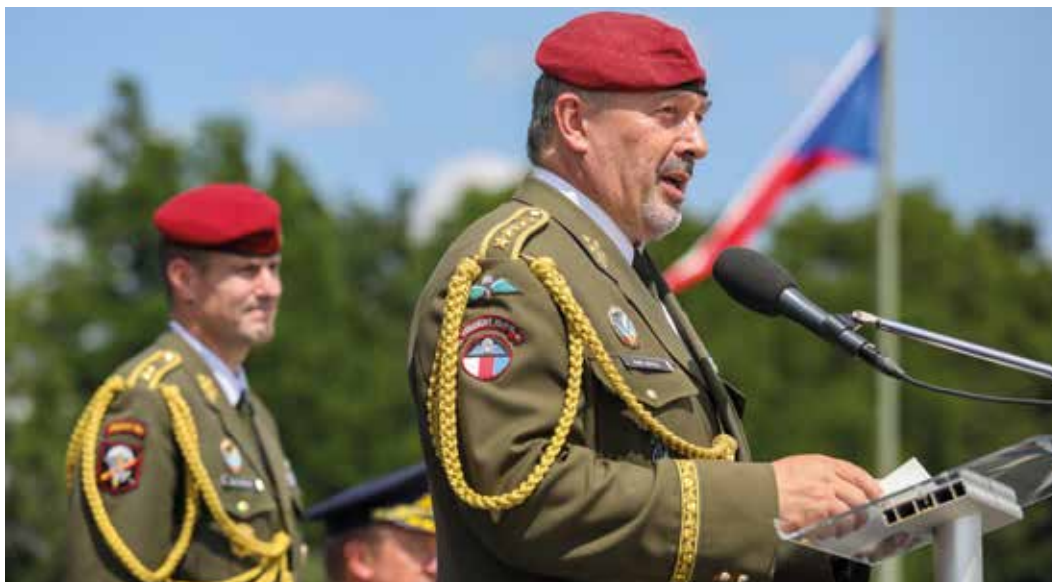
Čtyřleté působení ve funkci náčelníka Generálního štábu AČR ukončil generál Aleš Opat v polovině roku 2022. Funkci předal generálovi Karlu Řehkovi (vlevo) na Vítkově při oslavách Dne ozbrojených sil (červen 2022).

Změna se vždycky uskutečňuje v několika fázích, ať už jde o vojáky, zbraňové systémy, techniku nebo třeba přípravu na bezpečnostní hrozby. Za dalších třicet let armádu významným způsobem ovlivní nové technologie a to, čemu říkáme multidoménové operace, které už nejsou jenom pozemní, vzdušné nebo námořní, ale jsou rozšířené o oblast kybernetickou a také vesmírnou. Nepochybně se v armádě budou používat nejmodernější technologie včetně umělé inteligence. To, co dělá armády Severoatlantické aliance lepší a výkonnější, jsou skutečně špičkové technologie a jejich vhodné použití. Musíme se soustředit na to, abychom využitím technologií a výcvikem spolu s vedením bojové činnosti byli schopni udržovat krok správným směrem. Ale stále podle mě platí, že bude nutné udržovat vyváženost, aby žádná z domén nebyla výraznější než jiné. Před lety se například objevila myšlenka, že už nejsou zapotřebí tanky, protože všechno vyřeší počítače. Válka na Ukrajině ovšem ukázala, že to není pravda.