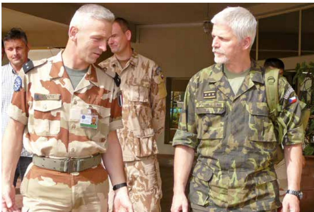
Od března 2013 čeští vojáci zabezpečovali v misi EUTM v Mali ostrahu velitelství výcvikové mise, doprovody osob a konvojů. Náčelník Generálního štábu AČR generál Petr Pavel jednal v Mali s velitelem výcvikové mise EUTM generálem Francoisem Lecointrem (červen 2013).

z armády utéct. Tehdy mi otec, nikoli jako voják, ale jako táta, řekl, že před překážkami se neutíká, protože když si na to člověk zvykne, bude to dělat pořád. A že všelijaké překážky jsou všude, v každé práci. Že je třeba to překousnout, najít si to, co člověka bude bavit, a pak se toho držet. A tak jsem si našel, co mě opravdu bavilo: byli to výsadkáři. Dal jsem si cíl opravdu hodně vysoko. A nebyli to vlastně jen výsadkáři, chtěl jsem se dostat ke speciální jednotce. Stejně jako dnes, i tehdy byla v armádě jen jedna – v Prostějově a výběr byl poměrně tvrdý. Tento cíl mě pak hodně motivoval.