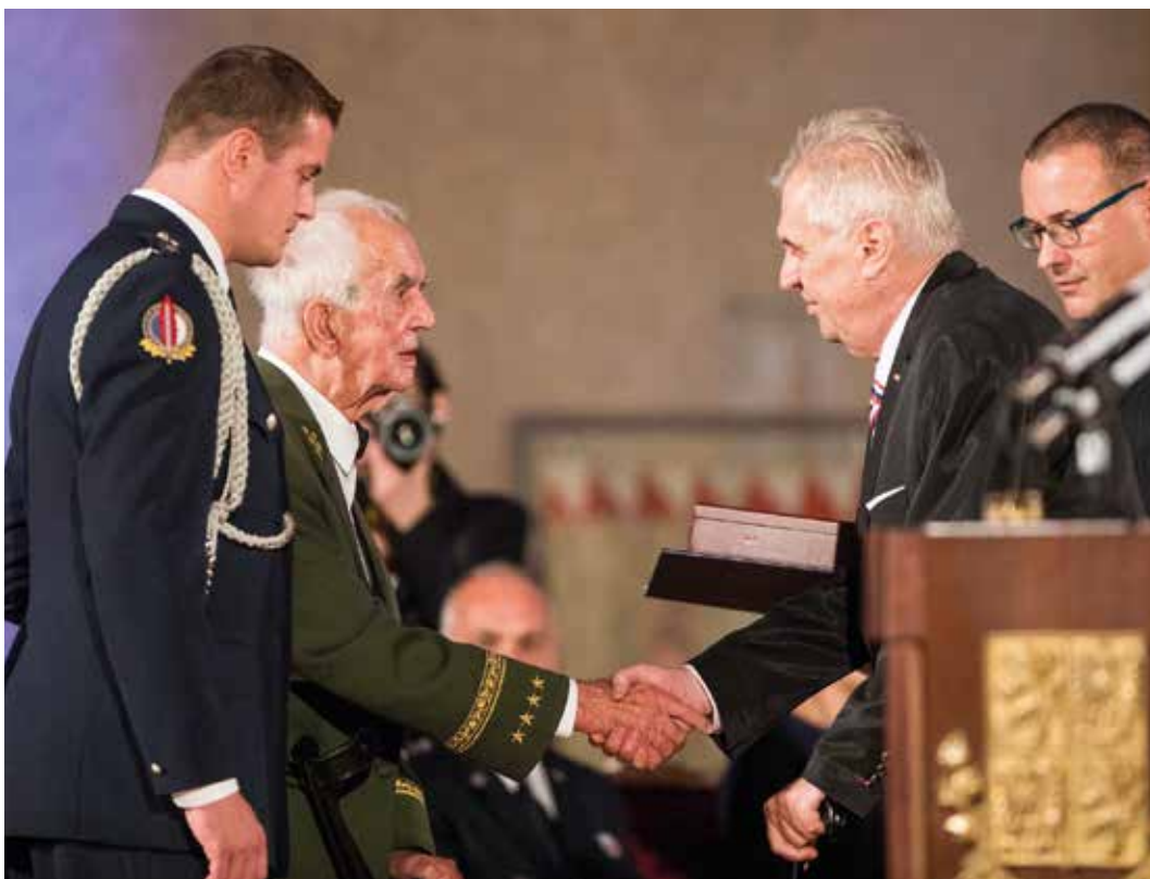
V roce 2017 při slavnostním ceremoniálu udílení státních vyznamenání na Pražském hradě převzal armádní generál Karel Pezl z rukou prezidenta republiky Miloše Zemana Řád Bílého lva I. třídy (říjen 2017).