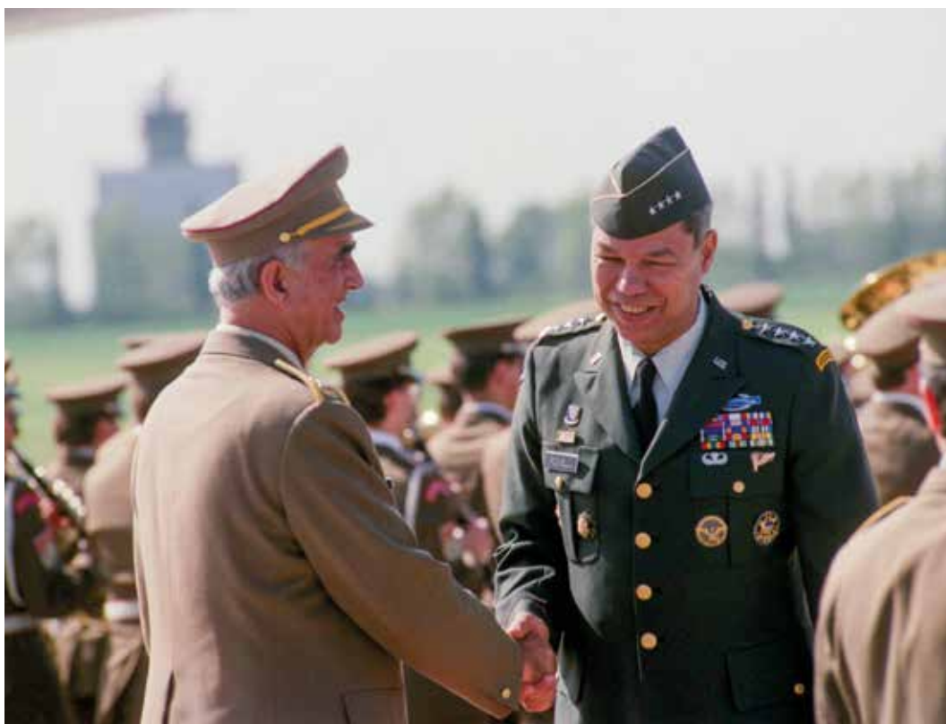
Generál Karel Pezl ve funkci náčelníka Generálního štábu Československé armády přivítal v Praze předsedu sboru náčelníků štábů ozbrojených sil USA generála Colina Powella (červenec 1992).