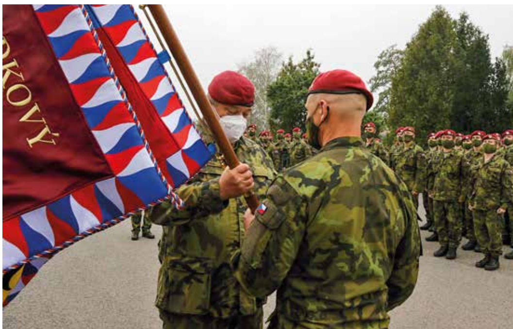
Slavnostního nástupu nově vzniklého 43. výsadkového pluku v roce 2020 se účastnil náčelník Generálního štábu AČR generál Aleš Opat. Při této příležitosti předal veliteli pluku plukovníkovi Róbertu Dziakovi bojový prapor (říjen 2020)

A rád bych zmínil také rozšíření zaměření naší armády, tedy aby neměla jenom těžké mechanizované jednotky, ale rovněž střední a lehké jednotky. Smyslem je, aby armáda dokázala adekvátně a podle potřeby reagovat na každou konkrétní situaci. Na druhou stranu platí, že žádný náčelník Generálního štábu nedokončí celou knihu, pouze napíše svou kapitolu. Svou napsal generál Pavel, svou generál Bečvář a tak dále. I já jsem napsal tu svou.