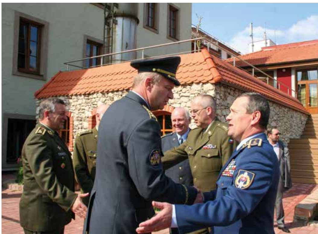
Výstavbou úkolového uskupení armád států Visegrádské čtyřky se zabývalo jednání náčelníků generálních štábů zemí V4 v roce 2012. Náčelník Generálního štábu AČR generál Vlastimil Pícek se loučí s náčelníkem Generálního štábu Ozbrojených sil Slovenské republiky generálem Peterem Vojtekem (duben 2012).