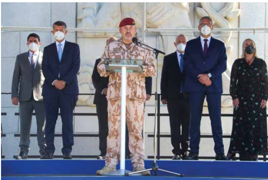
Největším nasazením českých vojáků v novodobé historii byla téměř dvacetiletá mise v Afghánistánu, ve které se vystříдалo zhruba 11 500 českých vojáků. V roce 2021 byla ukončena slavnostním nástupem na pražském Václavském náměstí. Náčelník Generálního štábu AČR generál Aleš Opat na něm přivítal významné hosty – představitele vlády i obou komor Parlamentu (září 2021).