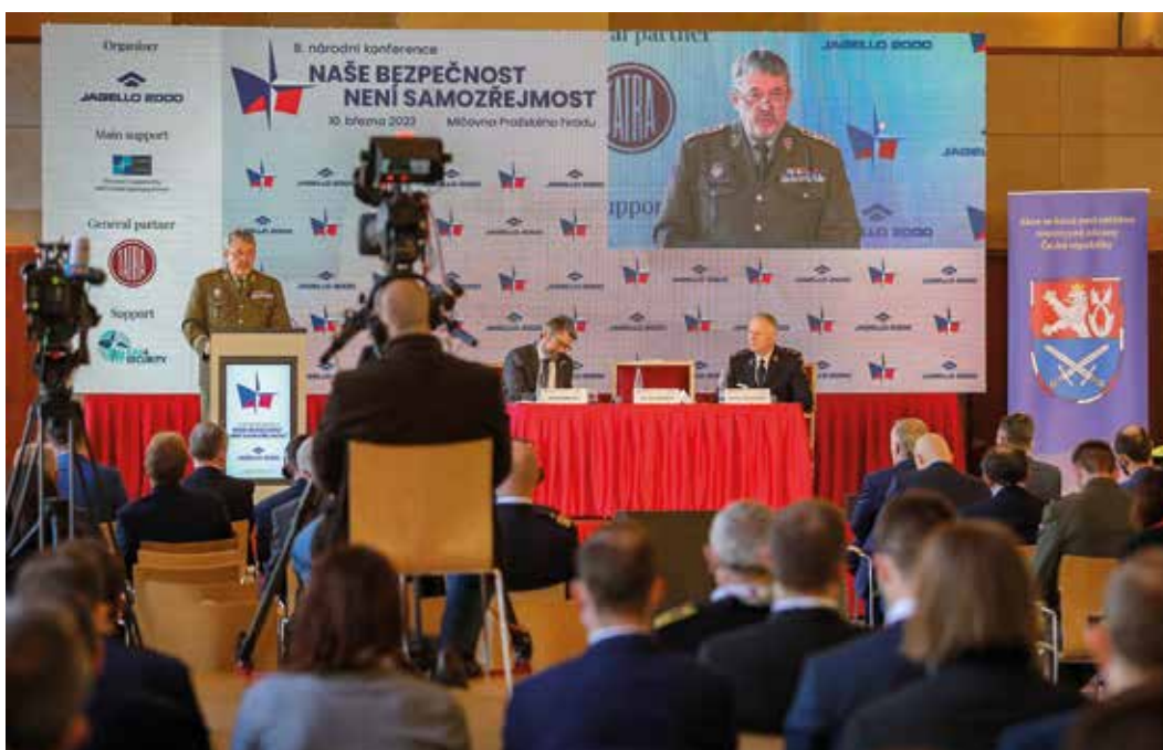
Na konferenci Naše bezpečnost není samozřejmost organizovanou sdružením Jagello 2000 jsou tradičně zváni také vedoucí představitelé armády. V roce 2022 byl jejím účastníkem náčelník Generálního štábu AČR generál Aleš Opaata (březen 2022).