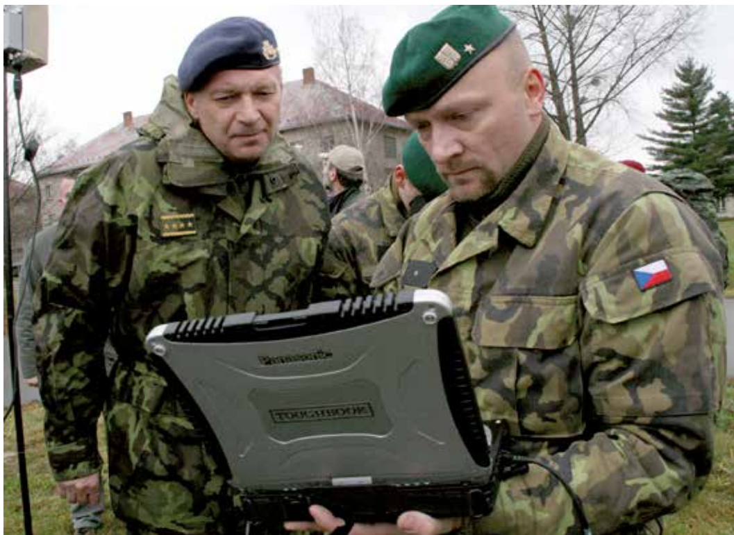
Náčelník Generálního štábu AČR generál Vlastimil Píček sleduje navádění bezpilotního průzkumného prostředku Raven při výcviku 5. kontingentu provinčního rekonstrukčního týmu AČR na Libavě před nasazením v misi ISAF v Afghánistánu (prosinec 2009).

V armádě se tehdy zaváděla nová digitální technika, a to se zase nevyučovalo na vojenské univerzitě. Proto tenkrát Ministerstvo obrany rozhodlo, že zaplatí