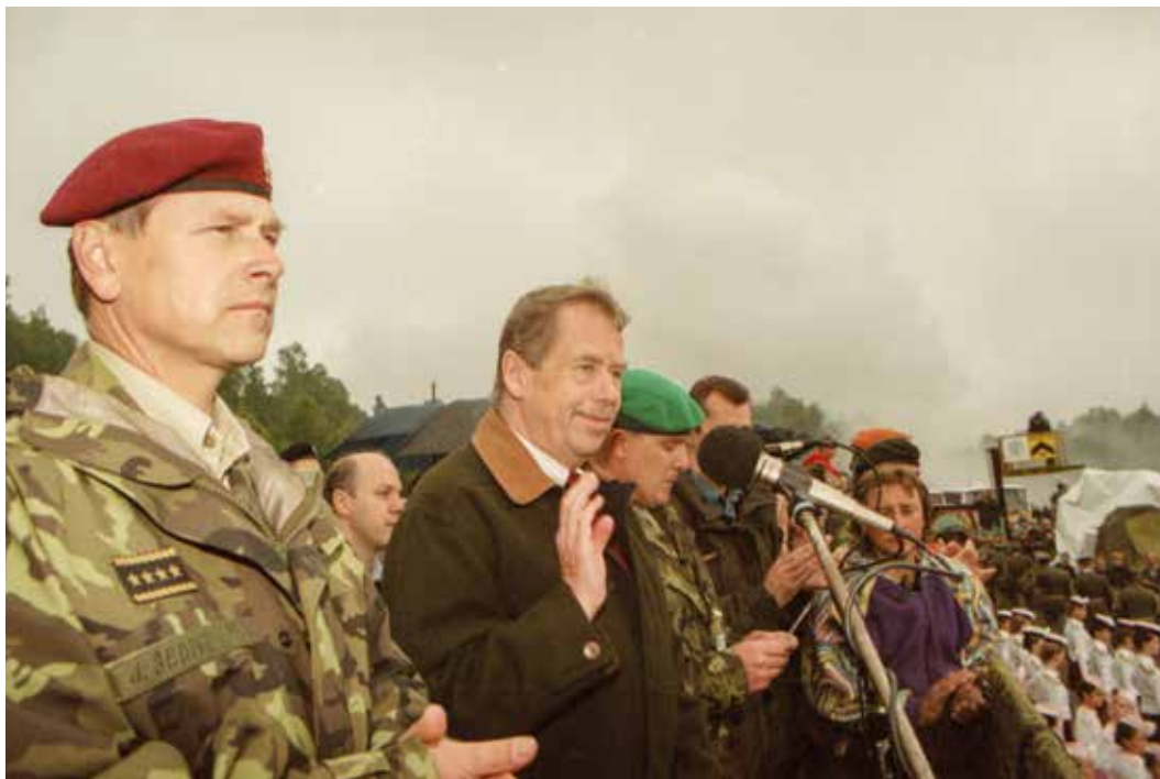
Přes 30 let je jednou z největších prezentačních akcí na veřejnosti Den pozemních sil – Bahna. V roce 2002 se jí zúčastnil prezident republiky Václav Havel (u mikrofonu); doprovázel jej náčelník Generálního štábu AČR generál Jiří Šedivý (červen 2002).

Vysokou školu jsem vystudoval s červeným diplomem, mohl jsem si proto dokonce vybrat posádku, takže jsem zamířil k tankistům do Stříbra.