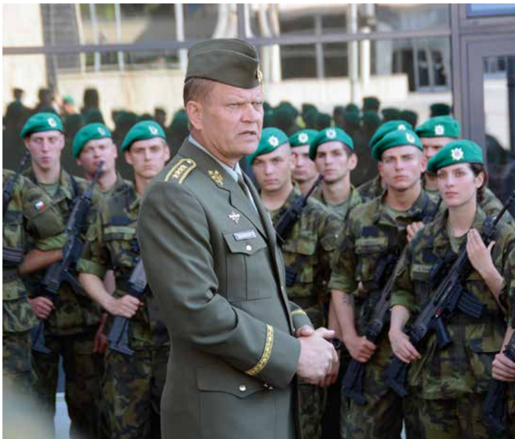
Náčelník Generálního štábu AČR generál Josef Bečvář ve Vyškově mezi účastníky kurzu základní přípravy, kteří se dobrovolně rozhodli stát vojáky aktivní zálohy a být připraveni doplnit profesionální armádu (srpen 2016).

To se vůbec nedá porovnat. Sloužil jsem ještě v předlistopadové armádě. Když jsem sloužil v Rokycanech, šel jsem do kasáren, zavřela se plechová vrata a byl jsem v jiném světě. Když jsem šel domů, ocitnul jsem se zase v druhém světě. Do kasáren byl zavedený jeden veřejný telefon. Pak přišel listopad 1989, začala se budovat moderní otevřená armáda, začaly vstupní rozhovory do NATO, což se stalo relativně rychle – už na jaře 1999.