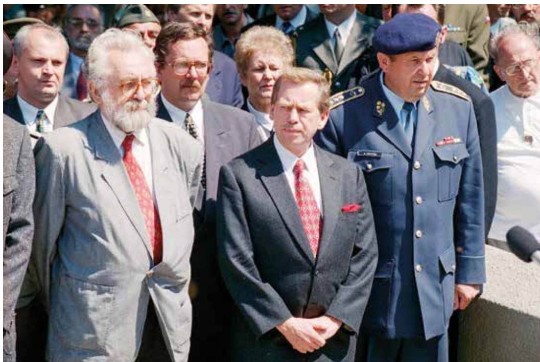
Náčelník Generálního štábu AČR generál Jiří Nekvasil v delegaci prezidenta republiky Václava Havla na Ukrajině při smuteční panychidě za vojáky padlé v bitvě u Zborova. Zleva náměstek ministra obrany Vladimír Šuman, prezident Václav Havel a generál Jiří Nekvasil (červenec 1997).