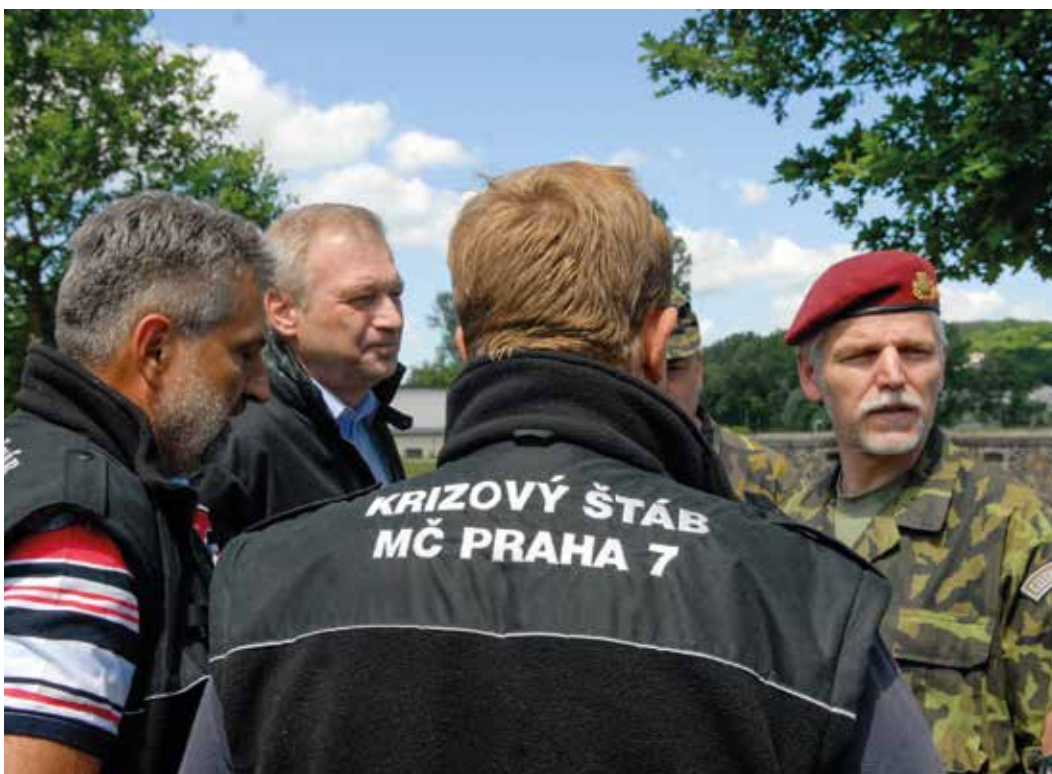
Při povodních na Císařském ostrově v Praze v roce 2013 pomáhali s likvidací následků také ženisté. Členové krizového štábu Městské části Praha 7 ocenili práci vojáků při návštěvě ministra obrany Vlastimila Picka (druhý zleva) a náčelníka Generálního štábu AČR generála Petra Pavla v místě nasazení (červen 2013).

armády je rovněž prospěšné, že může v Alianci sdílet poznatky a porovnávat zkušenosti. Izolovaná armáda, i když se bude snažit sebevíc, nebude nikdy dostatečně dobrá. Pokud se může s někým stále porovnávat, být v prostředí třiceti armád, získávat nové zkušenosti, vyhýbat se slepým uličkám, výrazně to zefektivňuje výdaje na obranu. Na naší armádě se to určitě ukázalo.