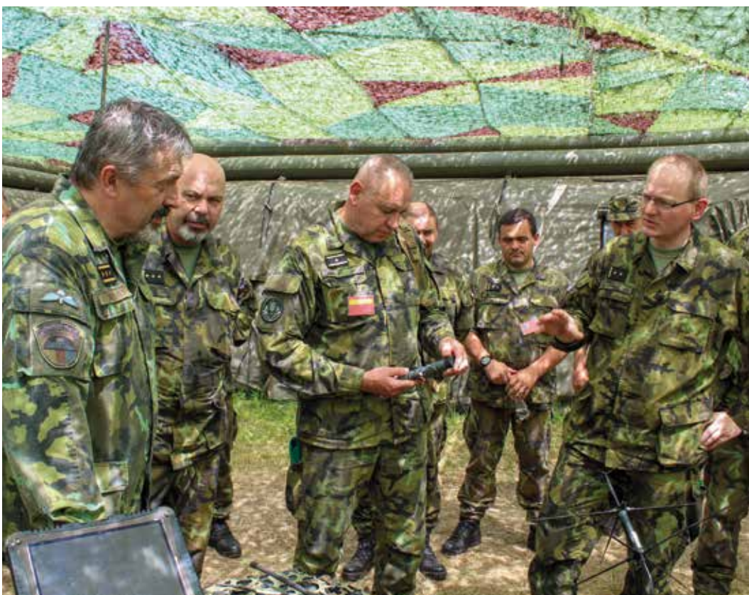
Náčelník Generálního štábu AČR generál Aleš Opat (vlevo) mezi účastníky mezinárodního cvičení spojovacích specialistů Federated Cloud (červen 2018)

Zažili jste také dramatické chvíle. Petr Pavel v jednom rozhovoru vzpomínal na okamžik, kdy mu na zátylek mířil samopalem srbský voják, a vy jste v jednu chvíli sykl směrem k němu: Veliteli, já ho smahnu, jo? Petr Pavel vám ale důrazně odpověděl, ať nic neděláte. Na takové chvíle se asi nedá zapomenout, že?