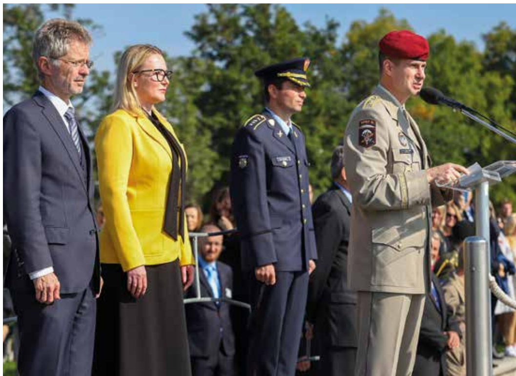
Náčelník Generálního štábu AČR generál Karel Řehka při projevu na slavnostním nástupu k 30. výročí zahájení mise UNPROFOR na území bývalé Jugoslávie; ministryně obrany Jana Černochová při této příležitosti předala pamětní odznaky 241 příslušníkům 1. česko-slovenského praporu (říjen 2022).

Ano, je to tak. Spousta lidí kurz nedokončí, je vyřazena, musí určitou fázi opakovat. Někdo to neovládne fyzicky, někdo se třeba zraní. Zajímavé je, že jste po celý kurz v poli, pořád jste na patrole, venku. Ráno se rozdělí pozice, jste na nějaké zajištěné základně v lese, dostanete úkol, třeba že musíte v noci provést přepad na nějaký objekt. Napřed se připravujete, pak šlapete spoustu kilometrů, ve dne i v noci, provedete podle rozkazu přepad, stáhnete se do určeného místa, kde vybudujete dočasnou základnu. A tak to jde pořád dokola. Mezitím jste jednou velitel družstva, pak obsluha kulometu a tak dále. Jak už jsem říkal, podstatné na těch kurzech je, že ve vás opět formují lídra. I v situaci, kdy máte problém sám se sebou, se musíte sebrat a motivovat lidi okolo sebe.