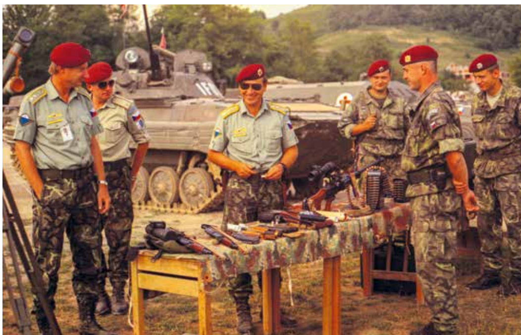
Součástí kontingentu AČR v operaci IFOR na území Bosny a Hercegoviny, kterému velel generál Jiří Šedivý (uprostřed), byl 6. mechanizovaný prapor. Snímek je ze základny 2. mechanizované roty českého praporu v obci Arapuša, kde vojáci připravili ukázkou výzbroje a techniky (květen 1996).