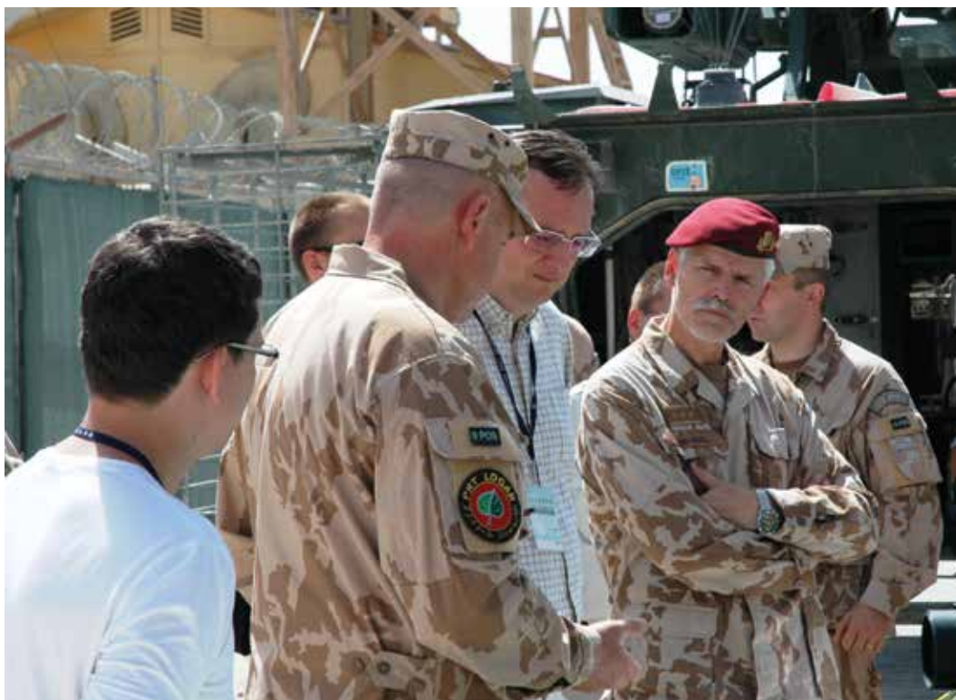
Náčelník Generálního štábu AČR generál Petr Pavel v doprovodu předsedy vlády ČR Petra Nečase na návštěvě 10. kontingentu provinčního rekonstrukčního týmu AČR v misi ISAF v Afghánistánu (září 2012)

Litoval, samozřejmě že ano. A vícekrát. Když jsem byl na gymnáziu a později na vysoké škole, setkal jsem se s věcmi, které tehdy v armádě byly celkem běžné. Občas nedostatek kompetence u některých důstojníků, občas prosazování rozkazů bez ohledu na to, jestli dávaly smysl, nebo nikoli. Těžko jsem se s tím vyrovnával. Měl jsem nutkání