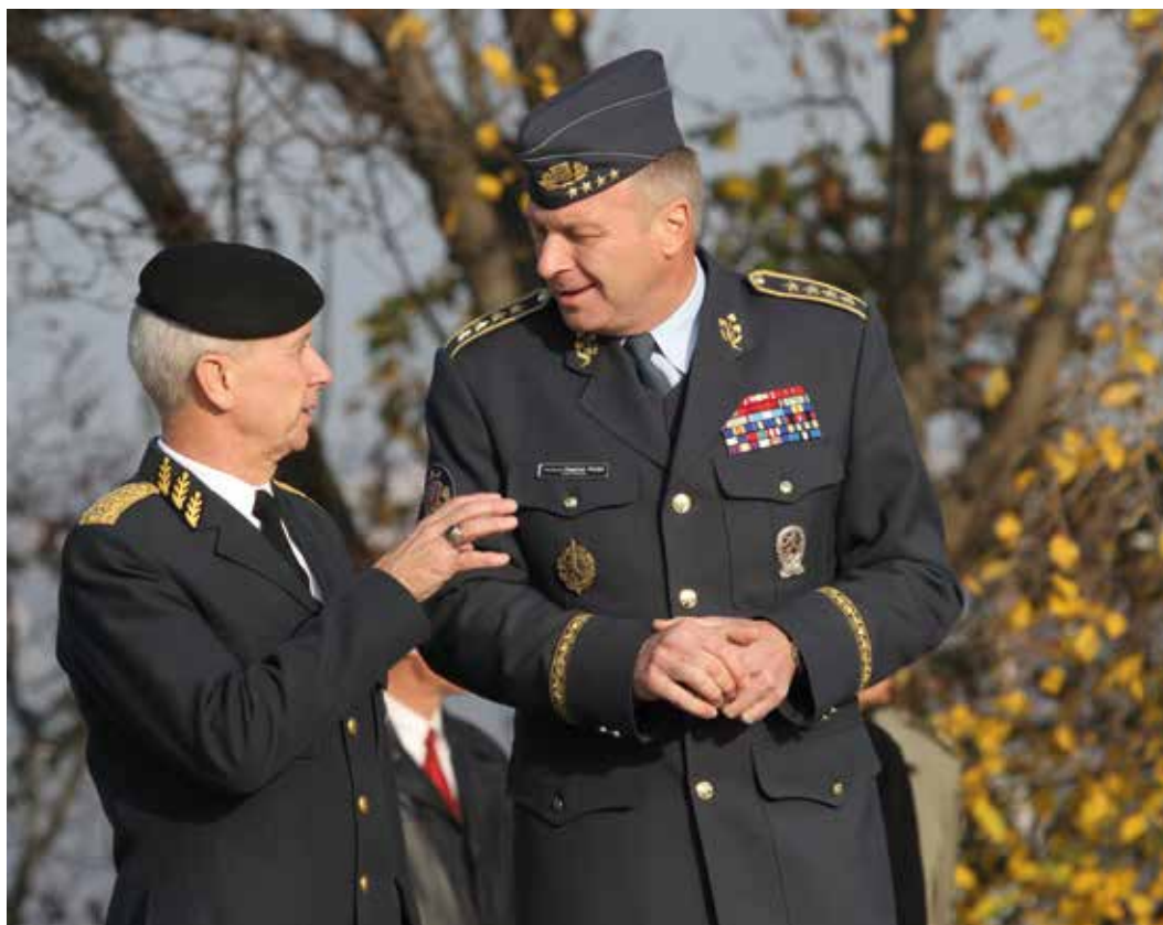
Náčelník Generálního štábu Ozbrojených sil Švédska generál Sverker Göranson (vlevo) přijal v roce 2011 pozvání náčelníka Generálního štábu AČR generála Vlastimila Pícky k návštěvě České republiky (listopad 2011).

Ano, dostal jsem doporučení od tehdejšího ministra obrany Jiřího Šedivého, který později působil například jako velvyslanec České republiky při NATO. A taky mě podpořila vláda Mirka Topolánka.