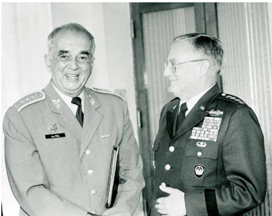
Náčelník Generálního štábu AČR generál Karel Pezl v rozhovoru s vrchním velitelem spojeneckých sil NATO v Evropě generálem Johnem Shalikashvilim při jeho návštěvě České republiky (červen 1993)

V šedesátých letech jste sloužil na Generálním štábu tehdejší Československé lidové armády, například jste vykonával funkci náčelníka operační přípravy. Ale z politických důvodů vás v roce 1971 z armády propustili. Nesmířil jste se s okupací „spřátelených vojsk“?