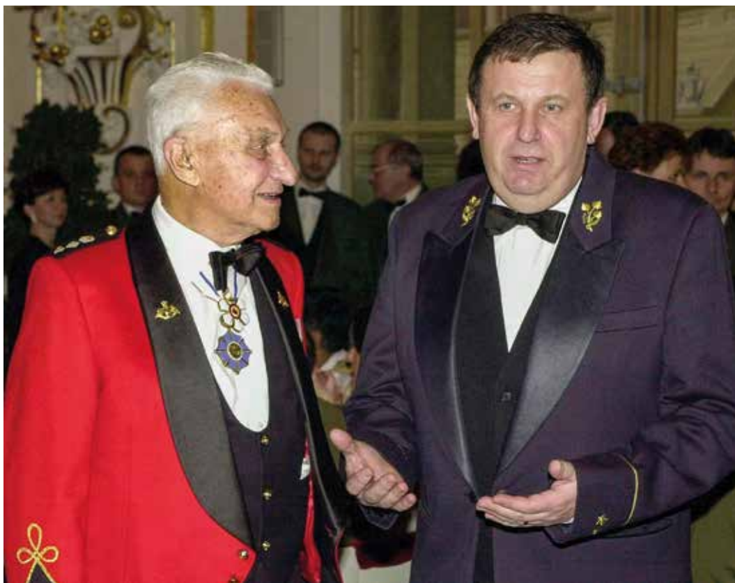
Generál Jiří Nekvasil se v roce 2020 setkal na Pražském hradě s podnikatelem Tomášem Baťou, který byl hostem reprezentačního plesu Armády České republiky (březen 2020).

Dělení začalo už před mým nástupem do čela Generálního štábu. Tehdy jsem se poprvé trochu zviditelnil, když jsem ve Staré Boleslavi dělil letectvo a protivzdušnou obranu. Letadla, rakety, radary a další prostředky a vybavení. Tehdy byla většina vojska na západě republiky, tedy v Česku. Pro dělení se přijal poměr dva ku jedné. Znamenalo to například, že se část vybavení letišť převážela na Slovensko. Bylo to ohromně složité, ale zároveň nekonfliktní, kulturní, rozešli jsme se v dobrém. Tak jako my se už ve světě nikdy nikdo nerozejde.