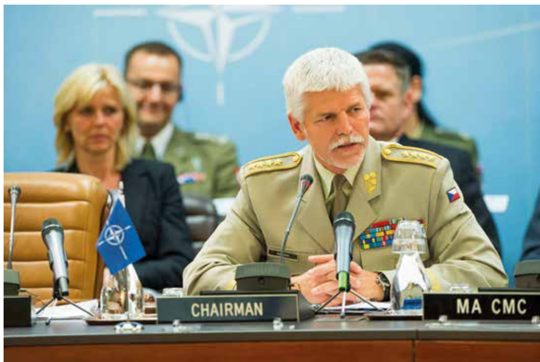
Generál Petr Pavel poprvé řídí jednání Vojenského výboru NATO ve funkci jeho předsedy (červen 2015).

Stručně řečeno: Alenka v říši divů. Říkal jsem tehdejšímu předsedovi sboru náčelníků Josephu Dunfordovi, který mi vyznamenání předával, že jsem si pocit Alenky prožil na stejném místě dvakrát. Během mého prvního studijního pobytu ve Spojených státech