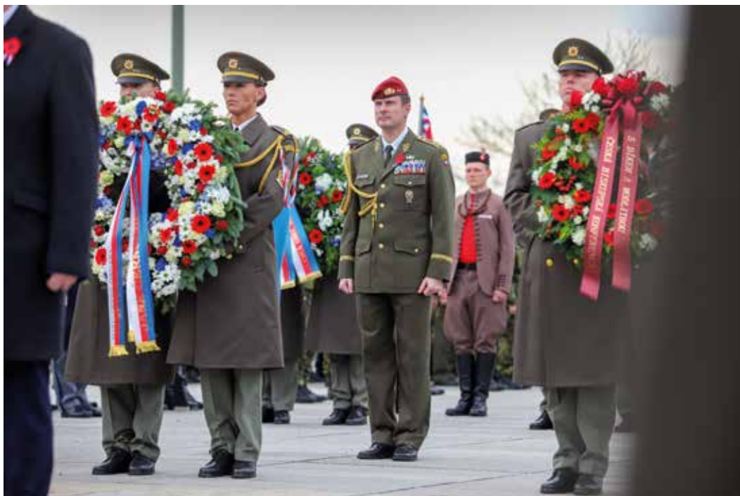
V novodobé historii České republiky bylo datum 11. listopadu jako Den válečných veteránů poprvé vzpomenuo v roce 2001. Náčelník Generálního štábu AČR generál Karel Řehka při slavnostním nástupu u Národního památníku na Vítkově (listopad 2022).

Naprosto zásadně. Změnila se samozřejmě technologicky. Vzpomínám si, když za mnou z Anglie přijeli začátkem devadesátých let mí spolužáci z vojenské školy. V centru Prahy jsme nemohli najít bankomat. A trvalo nám to opravdu hodně dlouho, než jsme nějaký našli. Dneska jsou skoro na každém rohu. Úplně stejně se změnila česká armáda, možná dokonce ještě více. V armádě jsou na prvním místě lidé. Jejich přístup a myšlení