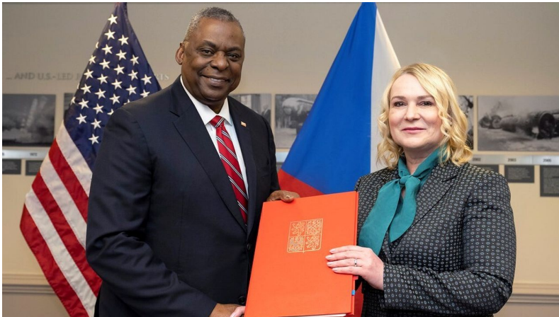
Lloyd Austin a Jana Černochová po podpisu smlouvy DCA

Všechny země světa, které jsou vedeny jako nepřátelské země, jsou zahrnuty v Gerasimovově doktríně jako země spadající do skupiny Salvo I, tedy země prvního úderu.