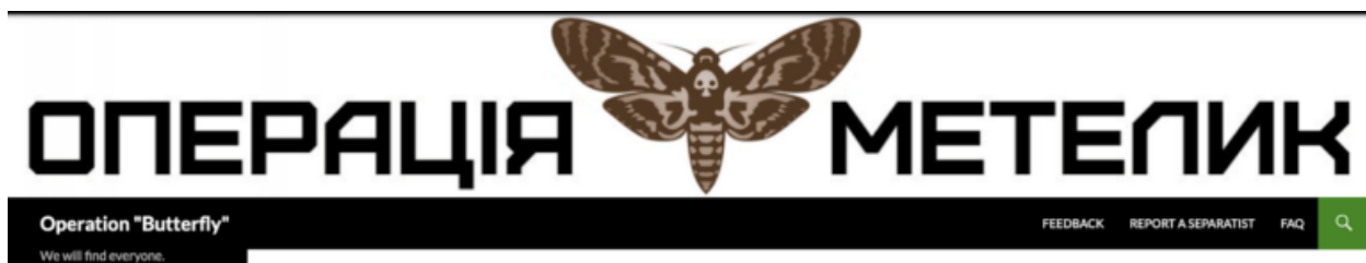
Web Operation Butterfly

Tinko je také registrátorem řady domén, které se zdají být součástí projektu Myrotvorets a jedné, která se zdá být prototypem. Zvláště jasný je záměr použít web k zabíjení zrádců nebo „teroristů“. Doména Metelek.org byla poprvé nárokována 21. července 2014 , tři týdny před první doménou Myrotvorets. Metelyk je ukrajinské slovo pro motýla. Webová stránka s názvem Operation Butterfly byla online na konci srpna 2014, první akcie v internetovém archivu se datují od 27. dne téhož měsíce.