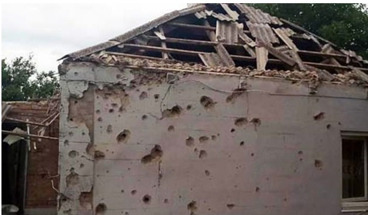
Dělostřelecké ostřelování je rozptýleno přes zed' proti centrální uličce obytné oblasti v regionu Záporizhzhya